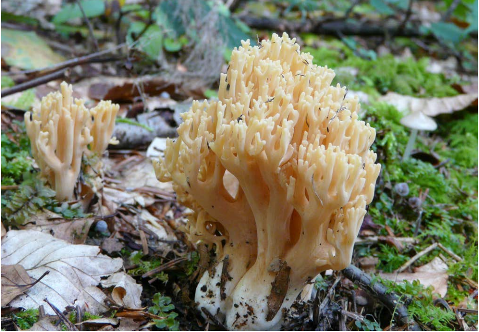
Fot. 29. Ramaria kriegelsteineri , ID: 263855.

Photo 29. Ramaria kriegelsteineri , ID: 263855.