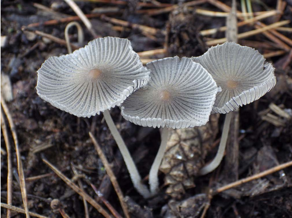
Fot. 6. Coprinellus velatopruinatus , ID: 262505.

Photo 6. Coprinellus velatopruinatus , ID: 262505.