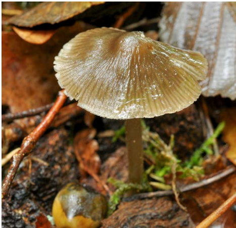
Fot. 13. Hydropus scabripes var. quadrisporus , ID: 261854. (fot. Mirosław Wantoch-Rekowski).

Zgon, 1,5 km NNW, pow. mrągowski, WM, MPK, Puszcza Piska, EB-68; 2013.09.14; las liściasty (Db, Gb); ściółka; MWR; BG; fot., zieln. (BGF/BF/MWR/130914/0016); ID: 261854 (fot. 13).