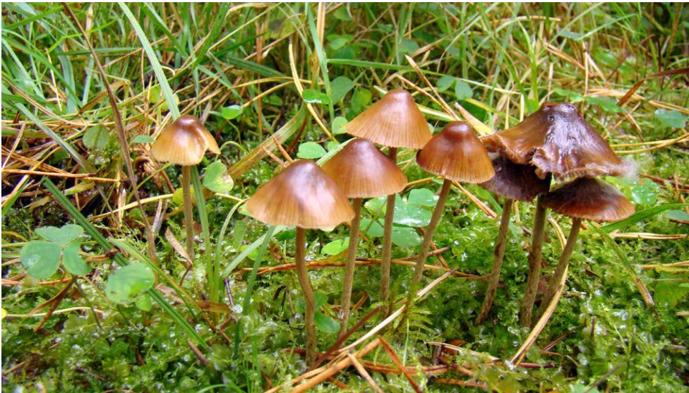
Fot. 26. Psilocybe medullosa , ID: 230973 (fot. Mirosław Gryc).

1. N od Skrwilna, pow. rypiński; KP, Lasy Skrwileńskie, DC-37; 2014.09.06; kępa Sw w lesie mieszanym; ziemia; AM; BG; fot., zieln. (BGF/BF/AM/140806/0001); ID: 253391. 2.