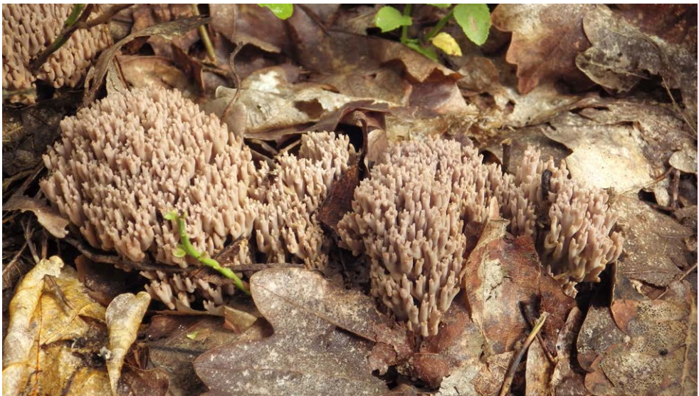
Fot. 27. Ramaria fennica var. fumigata , ID: 262508.

1. Olchowiec, pow. krośnieński, PK, JPK, FG-21; 2007.06.03, 2014.06.01; las Bk; ziemia; AH; BG; fot., zieln. (BGF/BF/AH/070607/0100, BGF/BF/AH/140601/0002); ID: 246508, 263368. 2. Supraśl, 6 km NE, pow. białostocki, PD, PKPK, GC-02; 2012.08.18; las mieszany (Gb, Db, Sw); ziemia; MG; BG; fot., zieln. (BGF/BF/MG/120818/0003); Kujawa et al. 2019; ID: 231020.