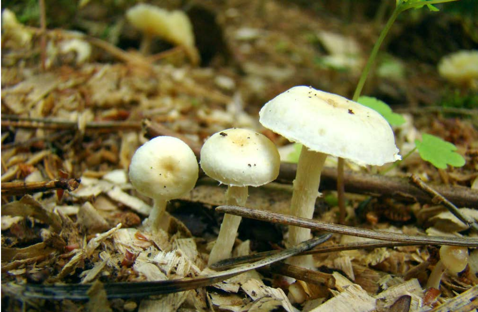
Fot. 32. Tubaria hololeuca , ID: 231060.