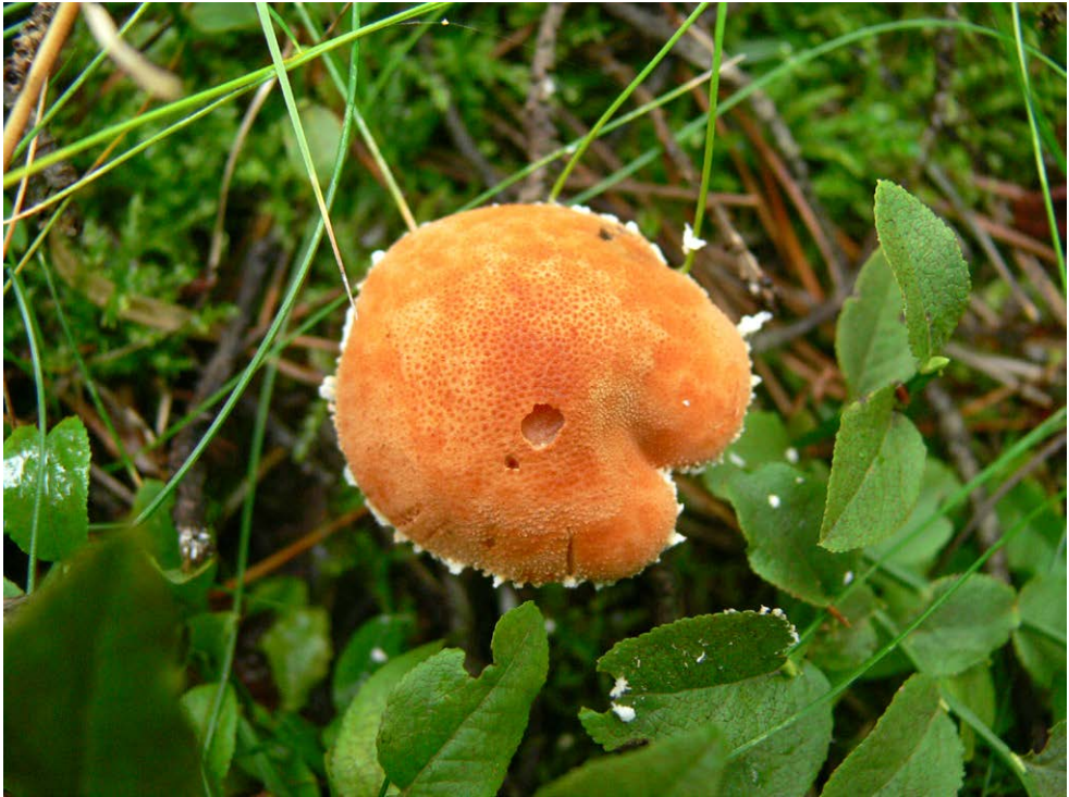
Fot. 8. Cystodermella adnatifolia , ID: 255002.

1. Kruplin-Barbarówka, 0,6 km E, pow. pajczański, LD, DE-54; 2014.11.10; zarośla liściaste (Wb, Brz); gałąź Wb; fot., zieln. (ISRL PAN, 5/JN/30.09.2015); ID: 252237. 2. Łęg,