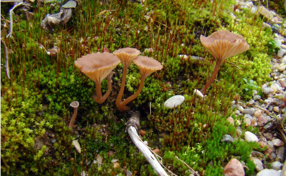
Fot. 21. Omphalina subhepatica , ID: 257489. Photo 21. Omphalina subhepatica , ID: 257489.

ki, PD, PKPK, GC-02; 2013.08.17; wilgotne zagłębienie, zadrzewienie liściaste; odchody jelenia; MG; BG; fot., zieln. (BGF/BF/MG/130817/0005); Kujawa et al. 2019; ID: 257479.