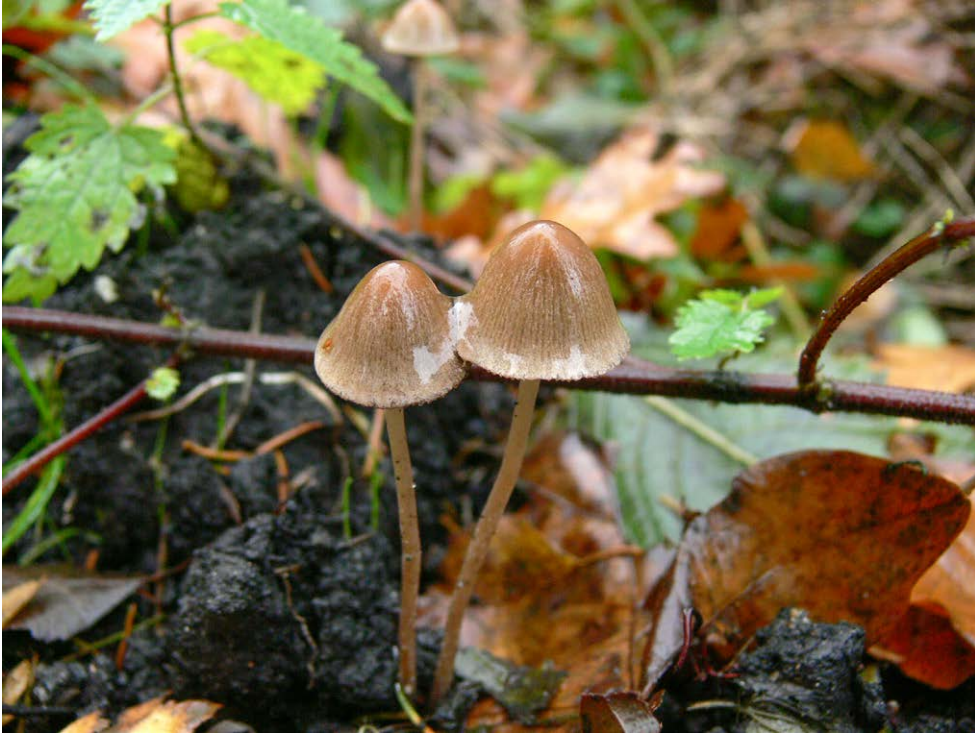
Fot. 24. Psathyrella orbicularis , ID: 274306.

Photo 24. Psathyrella orbicularis , ID: 274306.