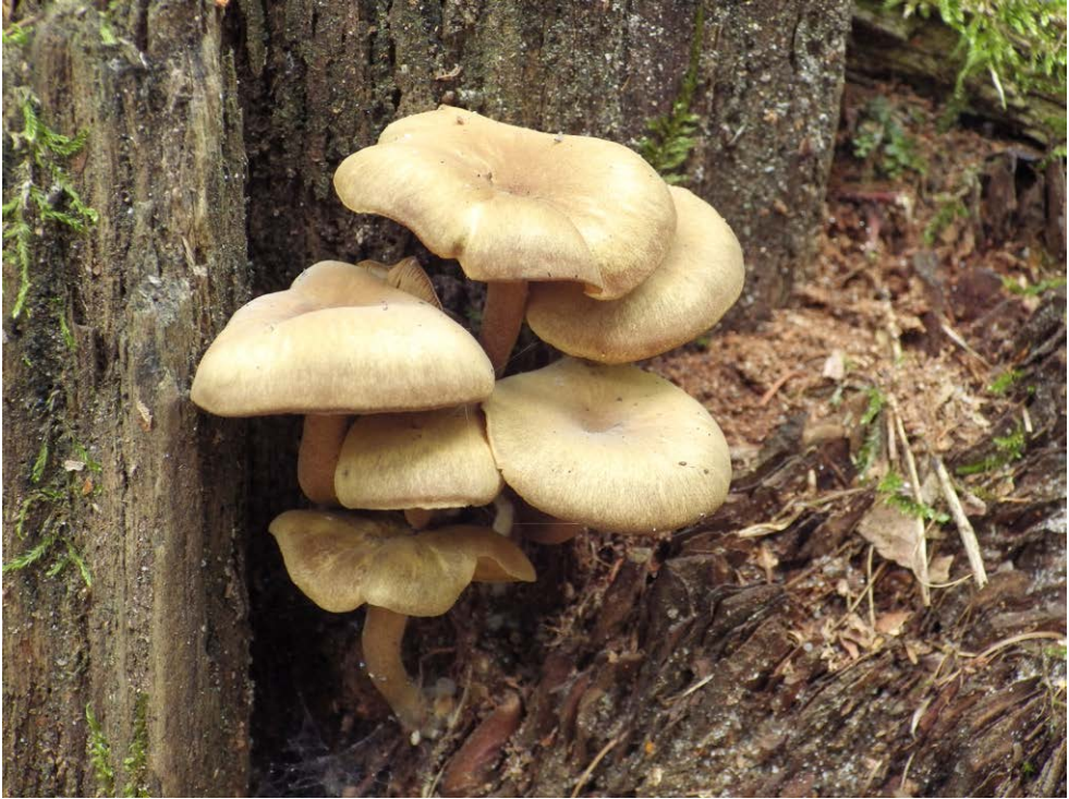
Fot. 5. Callistosporium pinicola , ID: 262994.

Photo 5. Callistosporium pinicola , ID: 262994.