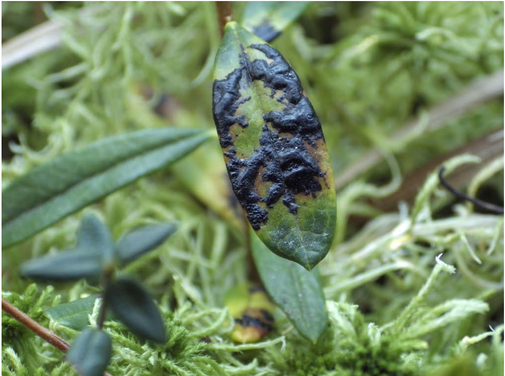
Fot. 1. Rhytisma andromedae , ID: 270134.

Radziechowice I, 2 km S, pow. radomszczański, LD, DE-55; 2015.10.10; bór So z domieszką Brz, torfowisko wysokie; liście Andromeda polifolia ; JN; fot., zieln. (ISRL PAN, 5/JN/25.11.2015); ID: 270134 (fot. 1).