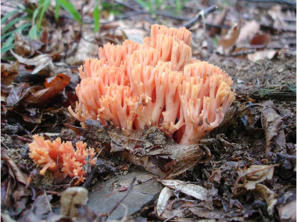
Fot. 31. Ramaria subbotrytis , ID: 263374. Photo 31. Ramaria subbotrytis , ID: 263374.

Ramariopsis crocea (Pers.) Corner; BwCL Tomaszów, 1 km NW, gm. Ładzice, pow. radomszczański, LD, DE-45; 2013.09.21; las mieszany (So, Brz, Czm, Kr); ziemia; JN; BG; fot., zieln. (BGF/BF/JN/130921/0001); ID: 254338.