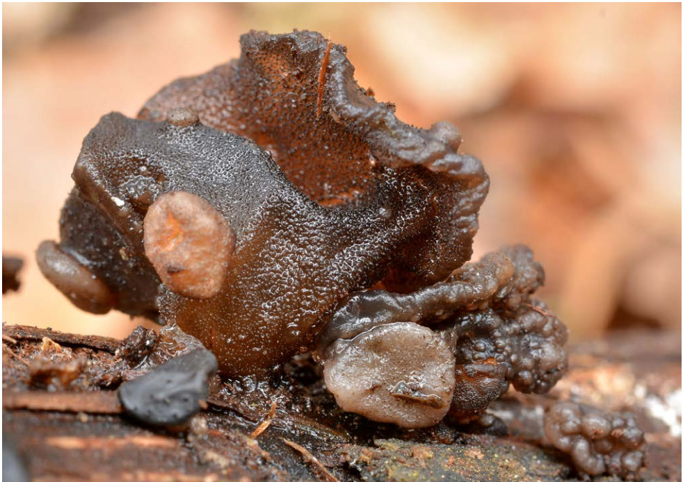
Fot. 12. Heteromycophaga glandulosae , ID: 256781.

Sopot, pow. Sopot, PM, 200 m N od Gdańska-Rynarzewa, TPK, CA-79; 2015.03.06; las mieszany (Bk, So, Db, Sw); owocniki Exidia glandulosa ; MWR; BG; fot., zieln. (BGF/BF/MWR/150306/0001); ID: 256781 (fot. 12).