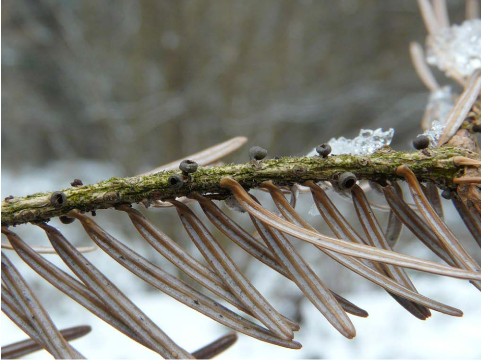
Fot. 2. Rutstroemia elatina , ID: 258133.

Photo 2. Rutstroemia elatina , ID: 258133.