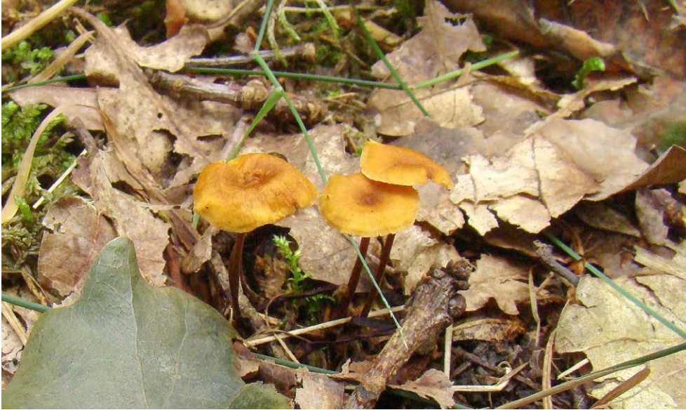
Fot. 34. Xeromphalina fraxinophila var. fraxinophila , ID: 255886. Photo 34. Xeromphalina fraxinophila var. fraxinophila , ID: 255886.

(273003), Antrodiella serpula (109241), Boletus radicans (169923), Clitocybe sinopica (238558), Cytidia salicina (257809), Delicatula integrella (241419), Geastrum melanocephalum (271608), G. minimum (248238), G. pectinatum (265002), G. quadrifidum (248239), G. striatum (255663, 254659), G. smardae (255660), G. triplex (248235), Gymnopilus spectabilis (227800), Hericium flagellum (248241), Hydnellum compactum (242910), H. conrescens (254802), Hygrophorus russula (255434), Hypsizygus ulmarius (255423), Inonotus hispidus (254705), Lactarius chrysorrheus (227138, 255430), L. controversus (245428), Lepiota magnispora (226584), Merismodes fasciculata (253739), Meruliopsis taxicola (139331), Mitrophora semilibera (258468), Mitrula paludosa (262440), Mutinus ravenelii (244046, 254722, 254803), Paxillus rubicundulus s.l. (268705), Pholiota adiposa (226583), P. mixta (253607), Pisolithus arrhizus (240566, 264992, 255667), Pleurotus cornucopiae (273004), Psathyrella spadicea (226618, 226897, 238563), Psilocybe montana (227124), Ramaria rubriperma-