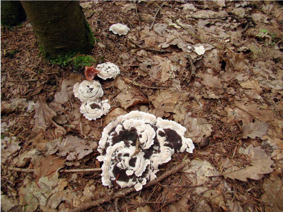
Fot. 22. Phellodon confluens , ID: 180324.

fot., zieln. (BGF/BF/JN/090818/0500); ID: 153750, 180295, 194818. 5. Grzebień, 1,5 km SW, pow. radomszczański, LD, DE-56; 2010.09.19; las liściasty (Db.cz); ziemia; JN; BG; fot., zieln. (BGF/BF/JN/100919/0500); ID: 185704. 6. Celina (leśniczówka Sowiinek), 0,8 km NW, pow. radomszczański, LD, DE-57; 2010.09.13; las Db-Jd; ziemia; JN; fot., zieln. (BGF/BF/JN/100913/0500); ID: 180324 (fot. 22). 7. Wikłów, 1,5 km SW, pow. częstochowski, SL, DE-64; 2009.08.02; las mieszany (So, Db, Brz); ziemia; JN; fot., zieln. (BGF/BF/JN/090802/0500); ID: 157383. 8. Teklinów, 1,5 km N, pow. częstochowski, SL, DE-65; 2010.09.11; las mieszany (Db, Brz, So); ziemia; JN; fot., zieln. (BGF/BF/JN/100911/0500); ID: 177523. 9. Jasień, 1,5 km SE, pow. radomszczański, LD, DE-67; las mieszany (So, Db, Brz); ziemia; JN; fot., zieln. (BGF/BF/JN/100924/0500); ID: 175645. 10. Supraśl, 5 km E, pow. białostocki, PD, PKPK, GC-02; 2010.08.06; las mieszany z przewagą