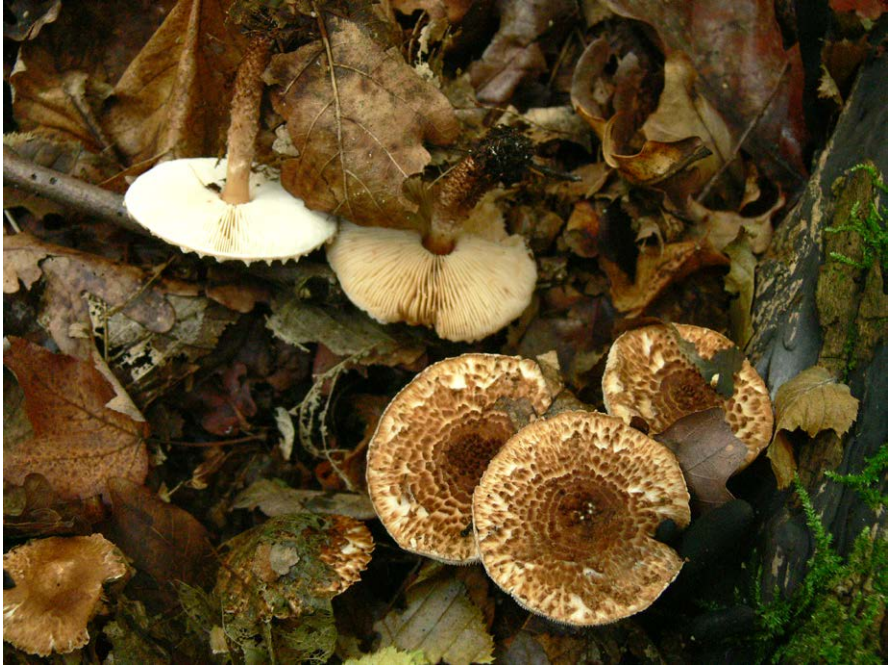
Fot. 9. Echinoderma carinii , ID: 274157.

Photo 9. Echinoderma carinii , ID: 274157.