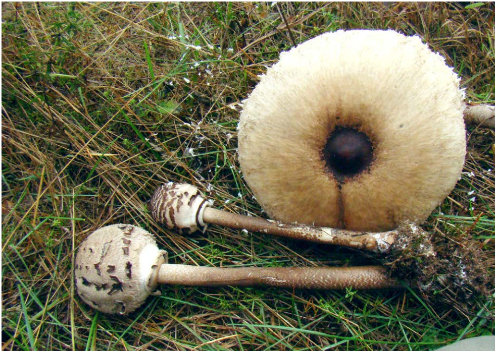
Fot. 20. Macrolepiota permixta , ID: 252288.

Lipie, 0,5 km NE, pow. radomszczański, LD, DE-55; 2014.08.30; las So; ziemia; JN; BG; fot., zieln. (BGF/BF/JN/140830/0001); ID: 252229.