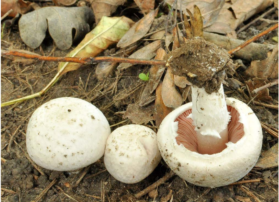
Fot. 3. Agaricus pampeanus , ID: 260470.

Poznań, pow. Poznań, WP, Park Cytadela, BD-08; 2015.07.31; zadrzewienie parkowe (Lp, Kl); kora użyta do ściółkowania; BG,