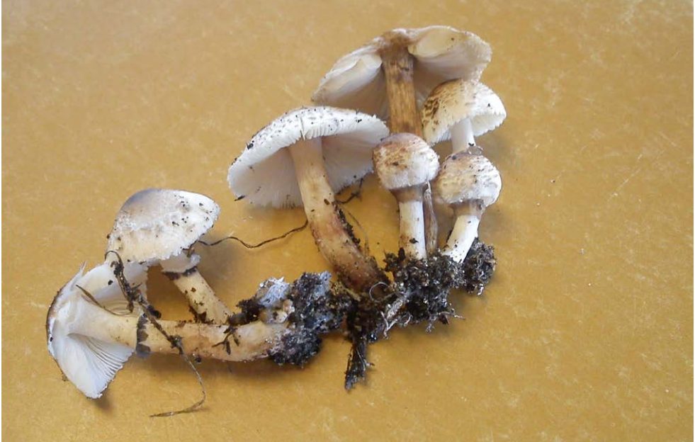
Fot. 19. Lepiota lilacea , ID: 255493.

Photo 19. Lepiota lilacea , ID: 255493.