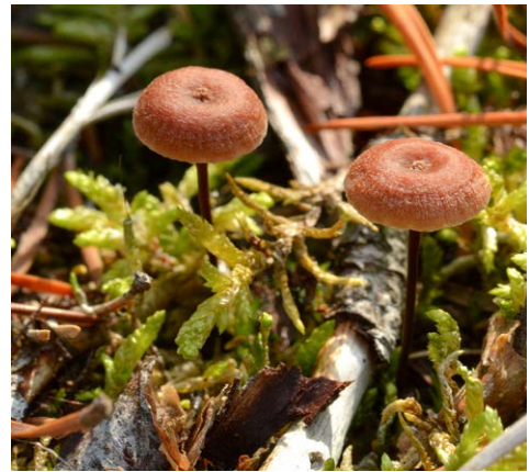
Fot. 33. Xeromphalina caudicinalis var. subfellea , ID: 253970.

Osetnik, pow. wejherowski, PM, CA-34; 2014.09.14; nadmorski bór So; ściółka, ziemia; MWR; BG; fot., zieln. (BGF/BF/MWR/140914/0005); ID: 253970 (fot. 33).