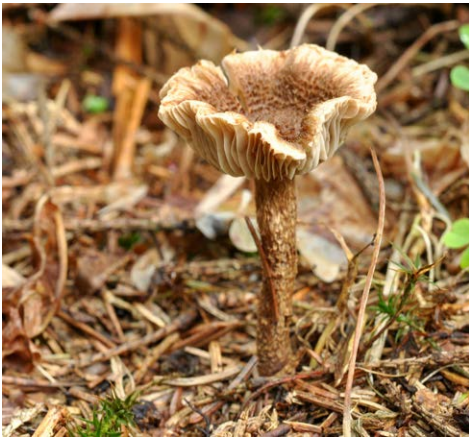
Fot. 17. Inocybe stellatospora , ID: 262108. (fot. Mirosław Wantoch-Rekowski).

Strzałowo, 1,3 km E, pow. mrągowski, WM, MPK, Puszcza Piska, EB-59; 2013.09.16; las z dominacją Sw; ziemia; MWR; BG; fot., zieln. (BGF/BF/MWR/130916/0011); ID: 262108 (fot. 17).