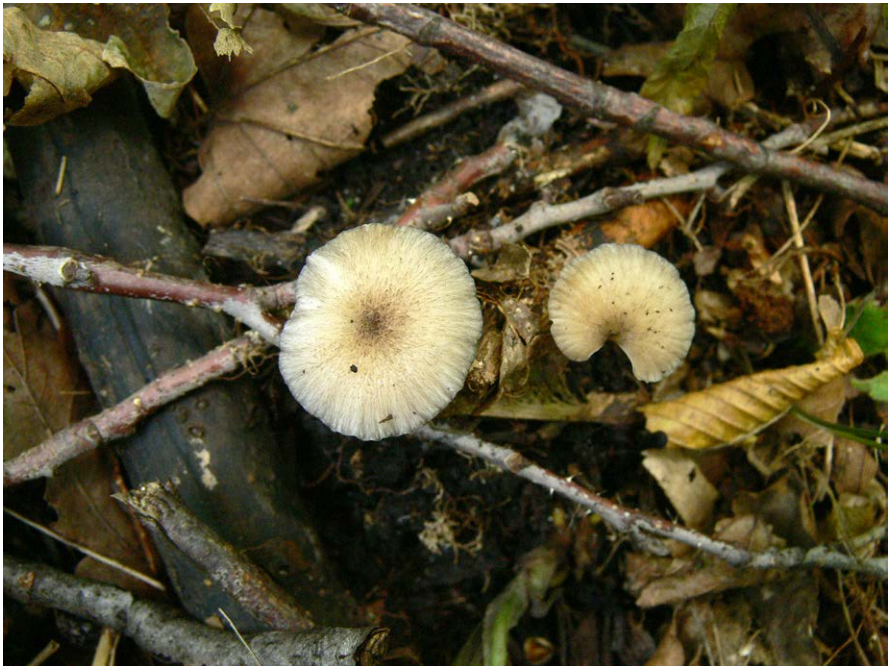
Fot. 10. Entoloma caesiocinctum , ID: 274159.

Photo 9. Echinoderma carinii , ID: 274157.