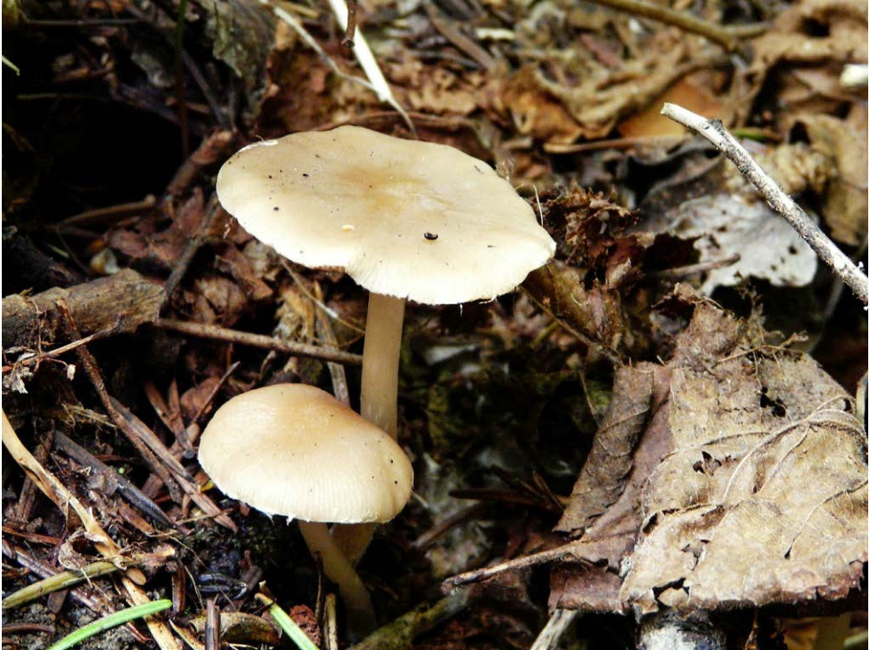
Fot. 25. Psathyrella praecox , ID: 245556.

Photo 25. Psathyrella praecox , ID: 245556.