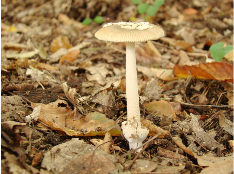
Fot. 4. Amanita olivaceogrisea , ID: 204953.

Photo 4. Amanita olivaceogrisea , ID: 204953.