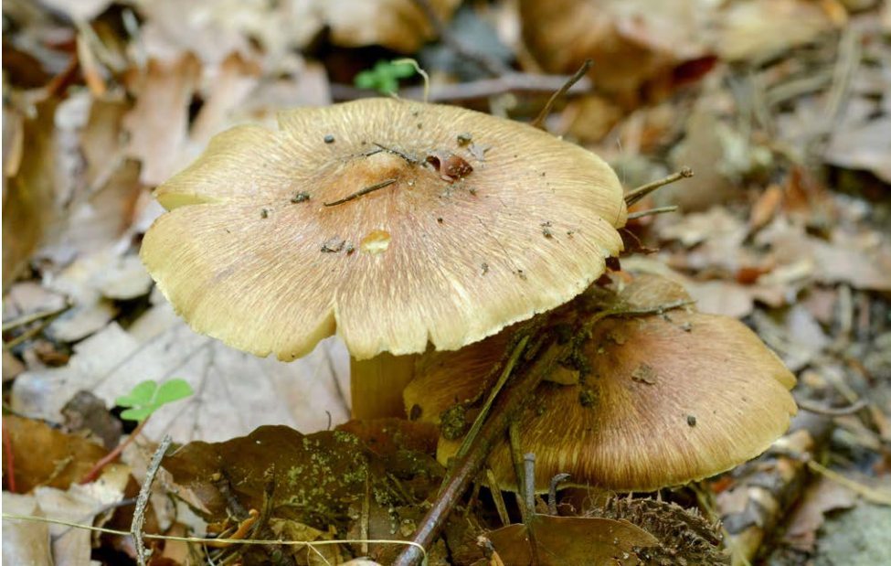
Fot. 14. Inocybe flavella , ID: 253870. Photo 14. Inocybe flavella , ID: 253870.