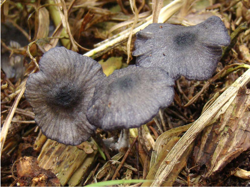
Fot. 11. Entoloma chytrophilum , ID: 255887.

Photo 11. Entoloma chytrophilum , ID: 255887.