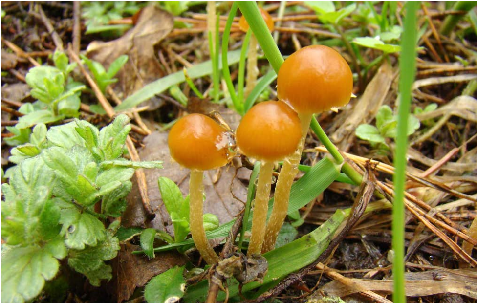
Fot. 23. Pholiotina nemoralis var. dentatomarginata , ID: 230946.

Krasny Las, 0,7 km N, pow. białostocki, PD, PKPK, GC-11; 2013.05.03; las z przewagą drzew iglastych, przydroże; resztki drewna; MG; BG; fot., zieln. (BGF/BF/MG/130503/0001); Kujawa et al. 2019; ID: 230946 (fot. 23).