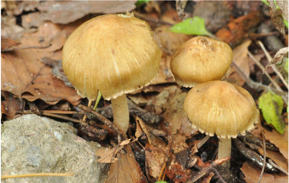
Fot. 15. Inocybe hirtella var. bispora , ID: 262115.

Photo 15. Inocybe hirtella var. bispora , ID: 262115.