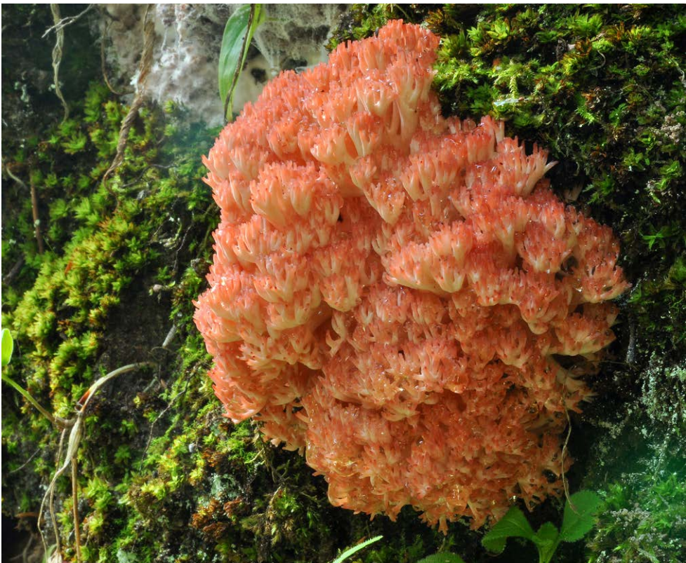
Fot. 30. Ramaria rubripermanens , ID: 202365.

1. Gdańsk-Oliwa, pow. Gdańsk, PM, ul. Spacerowa, TPK, CA-89; 2010.08.17; las mieszany (Bk, Sw, Db); ziemia; MWR; BG; fot., zieln. (BGF/BF/MWR/100817/0100); ID: 171276. 2. Między Olchowcem a Polanami-Dobańce, pow. jasielski, PK, JPK, FG-21; 2007.06.27, 2014.07.27; las Gb; ziemia; AH; BG; fot., zieln. (BGF/BF/AH/070627/0100, BGF/BF/AH/140727/0001); ID: 263374 (fot. 31), 263910. 3. Supraśl, 6 km NE, pow. białostocki, PD, PKPK, GC-02; 2012.08.18; las mieszany (Gb, Db, Sw); ziemia; MG; BG; fot., zieln. (BGF/BF/MG/120818/0002); Kujawa et al. 2019; ID: 231021.