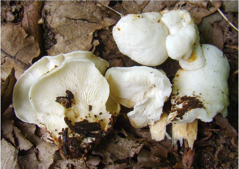
Fot. 18. Lentinellus auricula , ID: 243054.

1. Radomsko-Bogwidzowy, 1 km NE, pow. radomszczański, LD, nad Radomką, DE-46; 2015.07.19; podmokły las nadrzeczny (Ol, Wb, Brz); gałąź Wb; JN; fot., zieln. (ISRL PAN, 4/JN/19.11.2015); ID: 265870. 2. Kle-