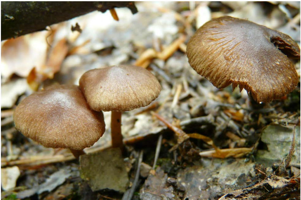
Fot. 16. Inocybe soluta , ID: 246515.

Mszana, pow. krośnieński, PK, koło skrzyżowania z drogą do Polan, FG-22; 2014.05.18; las mieszany (So, Bk, Tp.os, Brz, Lsz); ziemia; AH; BG; fot., zieln. (BGF/BF/AH/140518/0001); ID: 246515 (fot. 16).