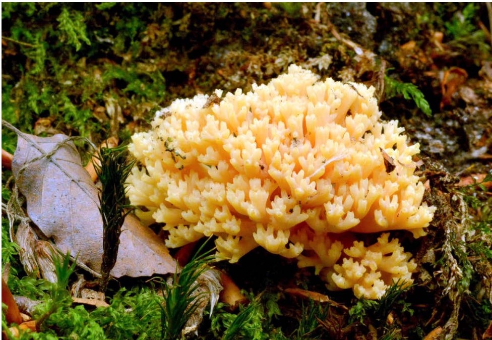
Fot. 28. Ramaria flavosalmonicolor , ID: 253932.

1. Okolice Babiego Dołu, pow. kartuski, PM, rez. Jar rzeki Raduni, CA-98; 2010.09.11;