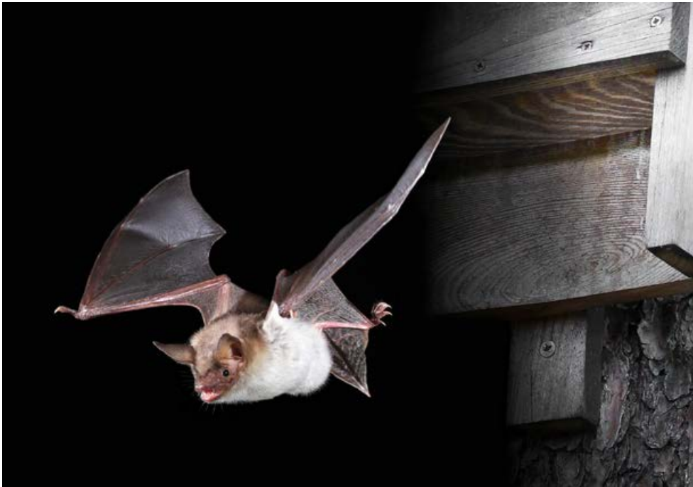
Fot 1. Noczek duży wylatujący ze skrzynki.

W Polsce w różnych typach skrzynek dla nietoperzy oraz budkach przeznaczonych dla ptaków zaobserwowano dotychczas 16 gatunków nietoperzy. W bogatej literaturze tematu opisywana jest dominacja 3 gatunków: karlika większego Pipistrellus nathusii , nocka Natterera Myotis nattereri i gacka brunatnego, natomiast mniej licznie notowano również: nocka dużego, nocka Bechsteina