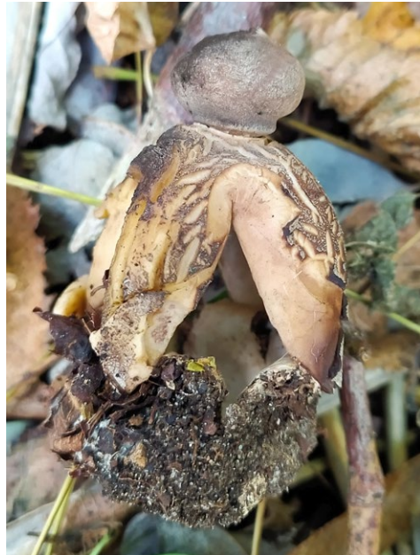
Fot. 17. Owocnik gwiazdosza wzniesionego Geastrum fornicatum ( ; 11.11.2023).

BC 79, Pojezierze Gnieźnieńskie, woj. wielkopolskie, pow. obornicki, gm. Rogoźno, Studzieniec, N 52.7006, E 17.0303, opuszczony cmentarz niemiecki porośnięty Ak i