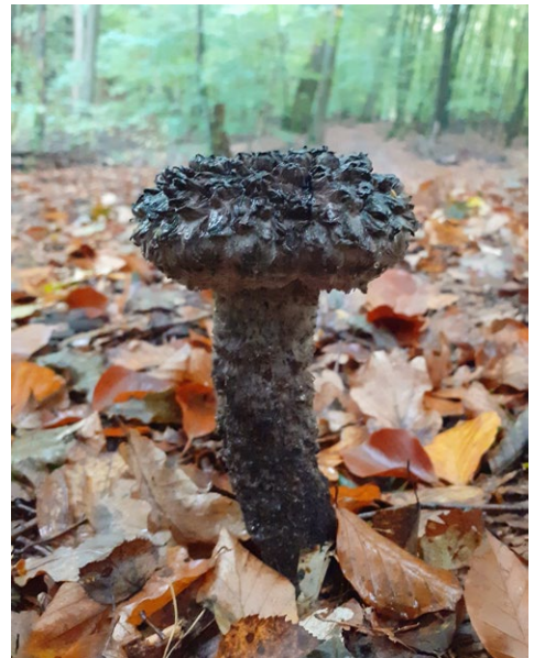
Fot. 29. Owocnik szyszkowca łuskowatego Strobilomyces strobilaceus.