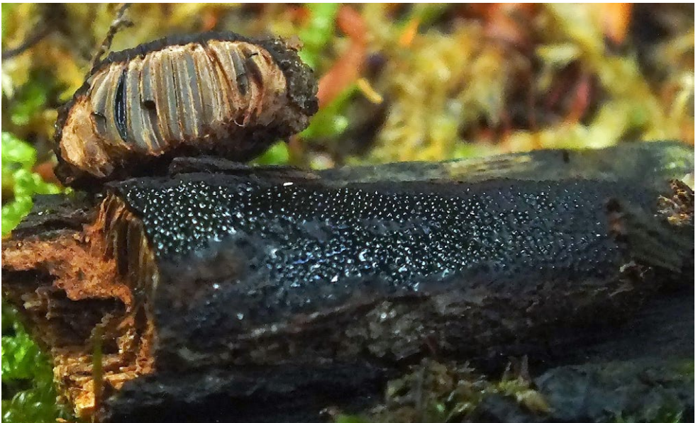
Fot. 2. Podkładka z owocnikami poduszniczki Camarops polysperma WA0000165591 ( 08.10.2023).

Photo 1. Aleuria aurantia WA0000165582 sporocarps ( 21.10.2023).