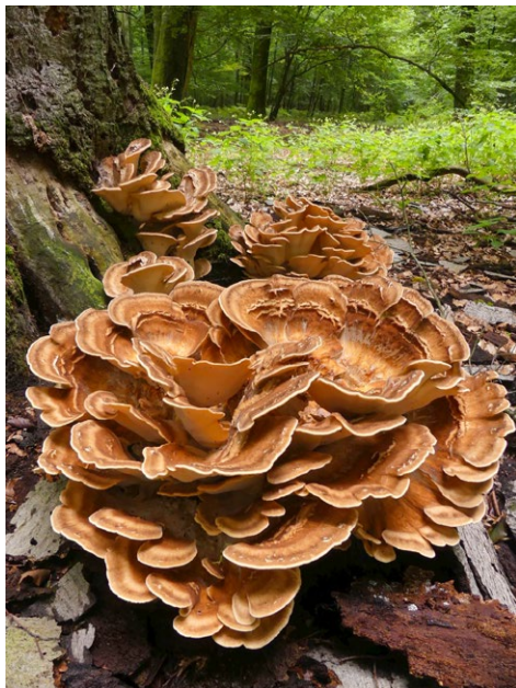
Fot. 24. Owocniki wachlarzowca olbrzymiego Meripilus giganteus WA0000165757.

Photo 24. Meripilus giganteus WA0000165757 sporocarps (photo by Marcin Łożek; 15.08.2023).