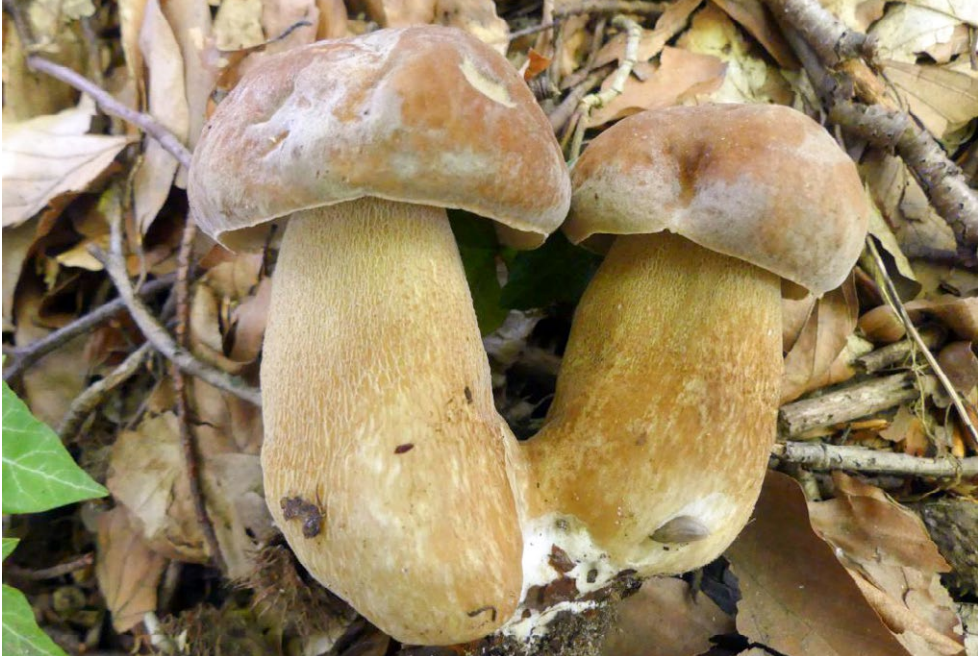
Fot. 10. Owocniki borowika usiatkowanego Boletus reticulatus WA0000165715 ( 13.08.2023).

Photo 10. Boletus reticulatus WA0000165715 sporocarps ( 13.08.2023).