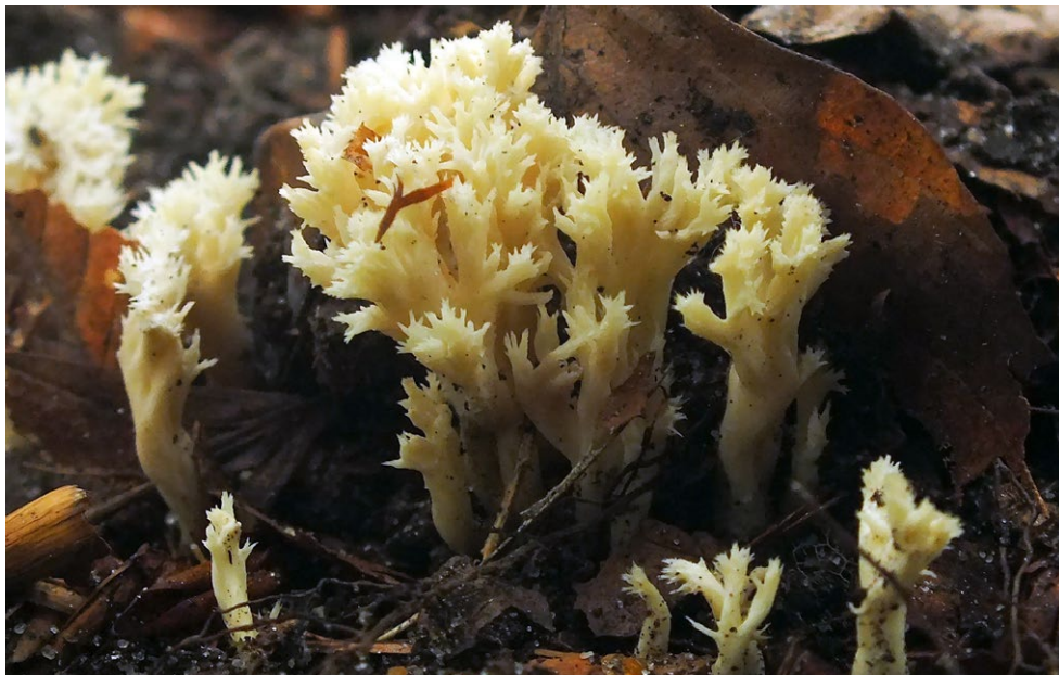
Fot. 13. Owocniki goździenicyka grzebieniastego Clavulina coralloides WA0000165617 ( ; 30.09.2023).

Photo 13. Clavulina coralloides WA0000165617 sporocarps ( ; 30.09.2023).