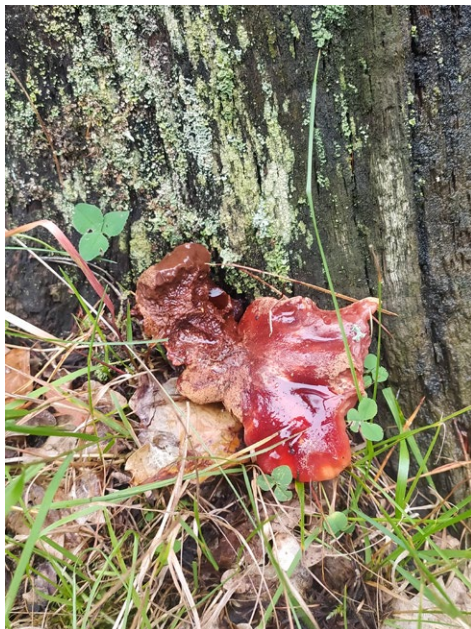
Fot. 15. Owocnik ozorka dębowego Fistulina hepatica.

Photo 15. Fistulina hepatica sporocarp (photo by Barbara Kudławiec; 07.10.2023).