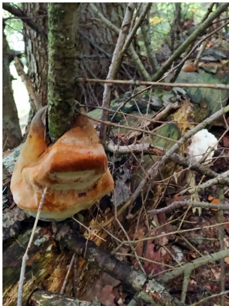
Fot. 27. Owocnik czyrenia jodłowego Phellinus hartigii

Photo 27. Phellinus hartigii sporocarp