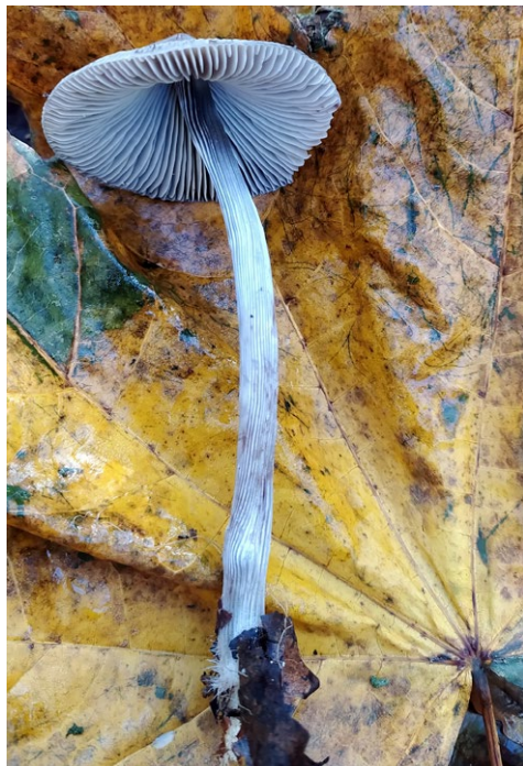
Photo 26. Mycena polygramma WA0000165843 sporocarp.

Fot. 26. Owocnik grzybówki bruzdowano-trzozonowej Mycena polygramma WA0000165843.