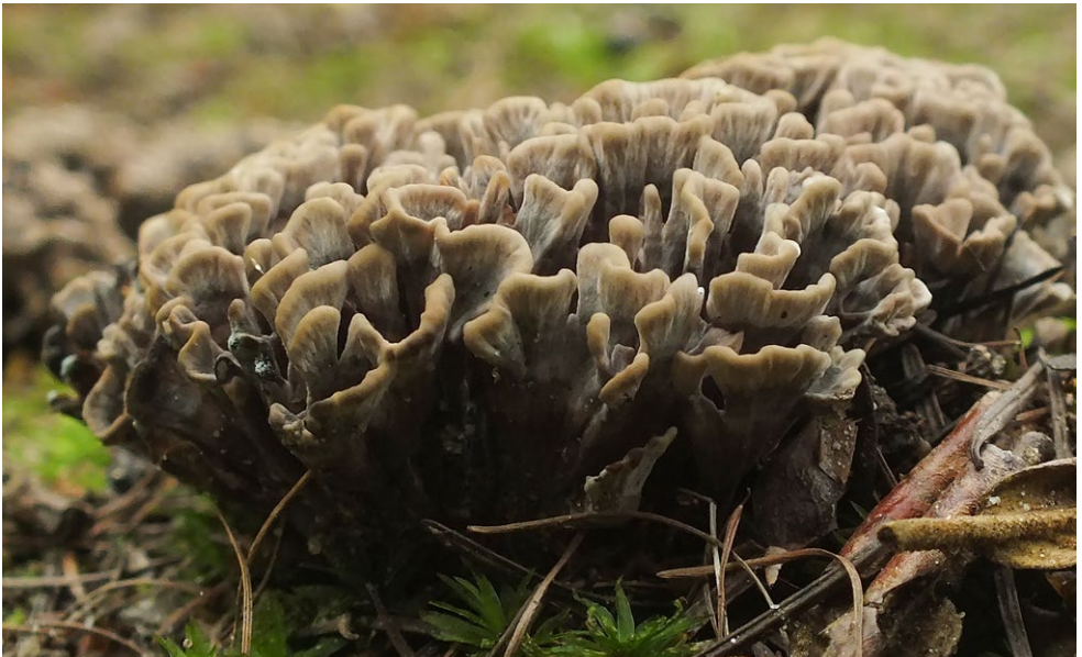
Fot. 31. Owocnik chropiutki cuchnącej Thelephora palmata WA0000165685.

Photo 30. Suillus bovinus WA0000165859 and Gomphidius roseus WA0000165822 sporocarps.