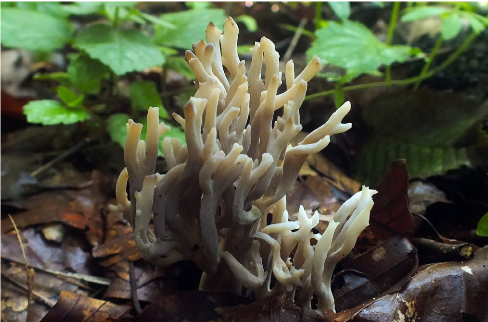
Fot. 12. Owocnik goździenicyka popielatego Clavulina cinerea WA0000165616 ( ; 16.08.2023).

Photo 11. Clavaria fragilis WA0000165583 sporocarps ( ; 21.10.2023).