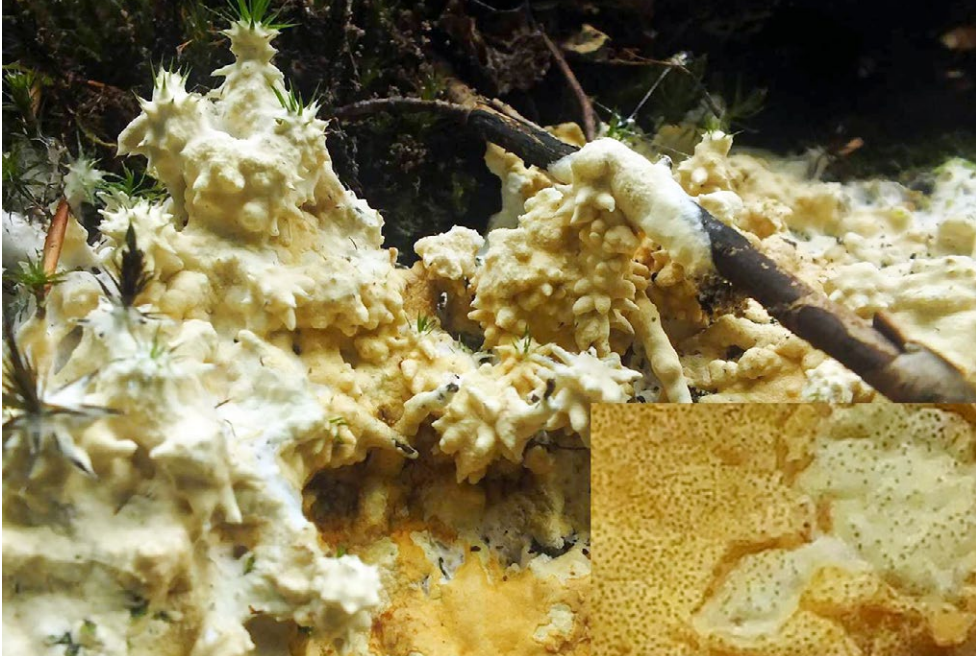
Fot. 8. Podkładka z owocnikami drobnokropki cytrynowej Trichoderma citrinum WA0000165593.