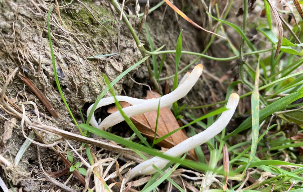
Fot. 11. Owocniki goździenca robakowatego Clavaria fragilis WA0000165583.

Photo 11. Clavaria fragilis WA0000165583 sporocarps (photo by Joanna Pawłowska; 21.10.2023).