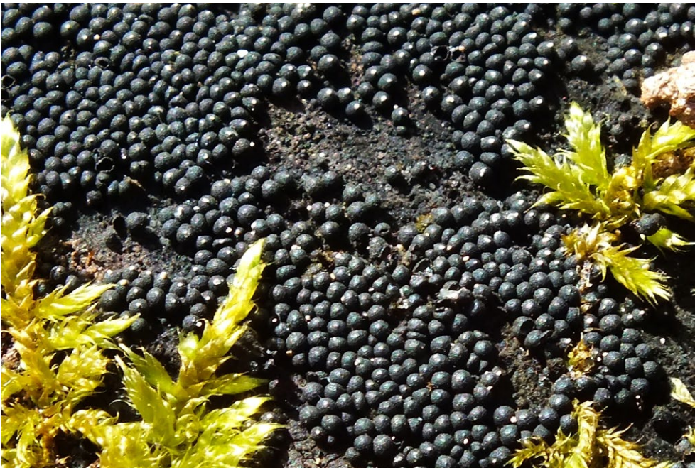
Fot. 5. Owocniki Ruzenia spermoides WA0000165597 ( ; 15.04.2018). Photo 5. Ruzenia spermoides WA0000165597 sporocarps ( ; 15.04.2018).