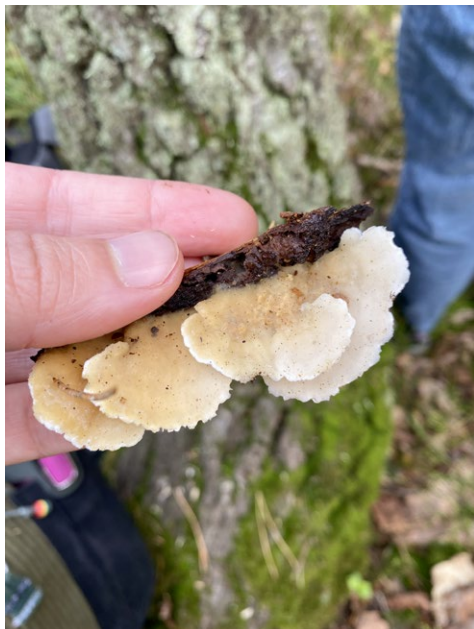
Fot. 32. Owocniki szklstoperek dwubarwny Vitreoporus dichrous WA0000165586 ( ; 11.10.2023).

Photo 32. Vitreoporus dichrous WA0000165586 sporocarps ( ; 11.10.2023).