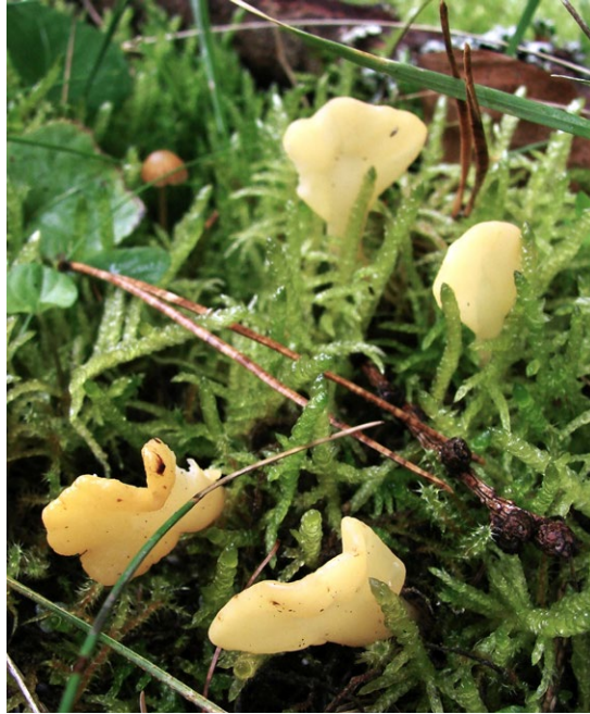
Fot. 6. Owocniki łopatkowate żółtawej Spathularia flavida WA0000165796 ( ; 07.10.2023). Photo 6. Spathularia flavida WA0000165796 sporocarps ( ; 07.10.2023).