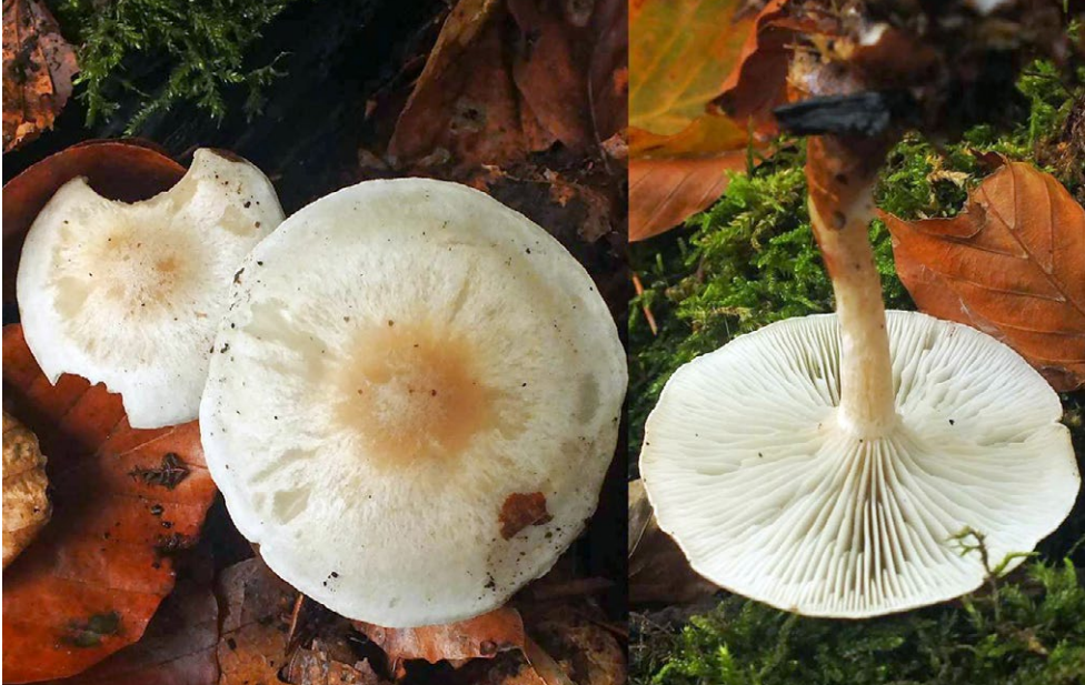
Fot. 14. Owocniki lejkówki duszącej Clitocybe fragrans WA0000165619 ( 04.11.2023).