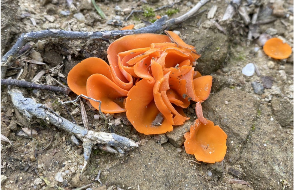
Fot. 1. Owocniki dziezki pomarańczowej Aleuria aurantia WA0000165582.

Photo 1. Aleuria aurantia WA0000165582 sporocarps.