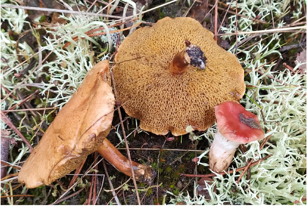
Fot. 30. Owocniki maślaka sitarza Suillus bovinus WA0000165859 oraz klejówki różowej Gomphidius roseus WA0000165822 ( ; 28.10.2023).

Photo 30. Suillus bovinus WA0000165859 and Gomphidius roseus WA0000165822 sporocarps ( ; 28.10.2023).