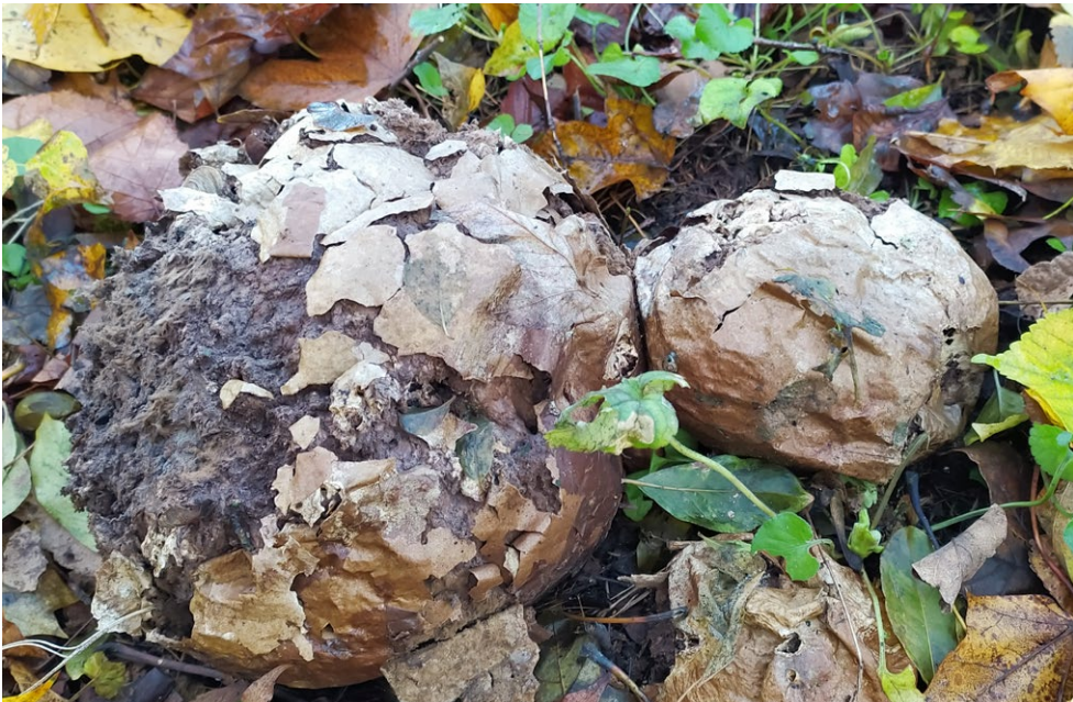
Fot. 23. Owocniki purchawicy olbrzymiej Langermannia gigantea ( 11.11.2023). Photo 23. Langermannia gigantea sporocarps ( 11.11.2023).