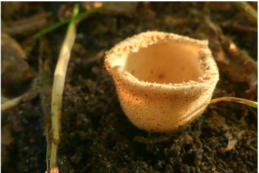
Fot. 7. Owocnik Tarzetta cupularis WA0000165702 ( 21.08.2023). Photo 7. Tarzetta cupularis WA0000165702 sporocarp ( 21.08.2023).