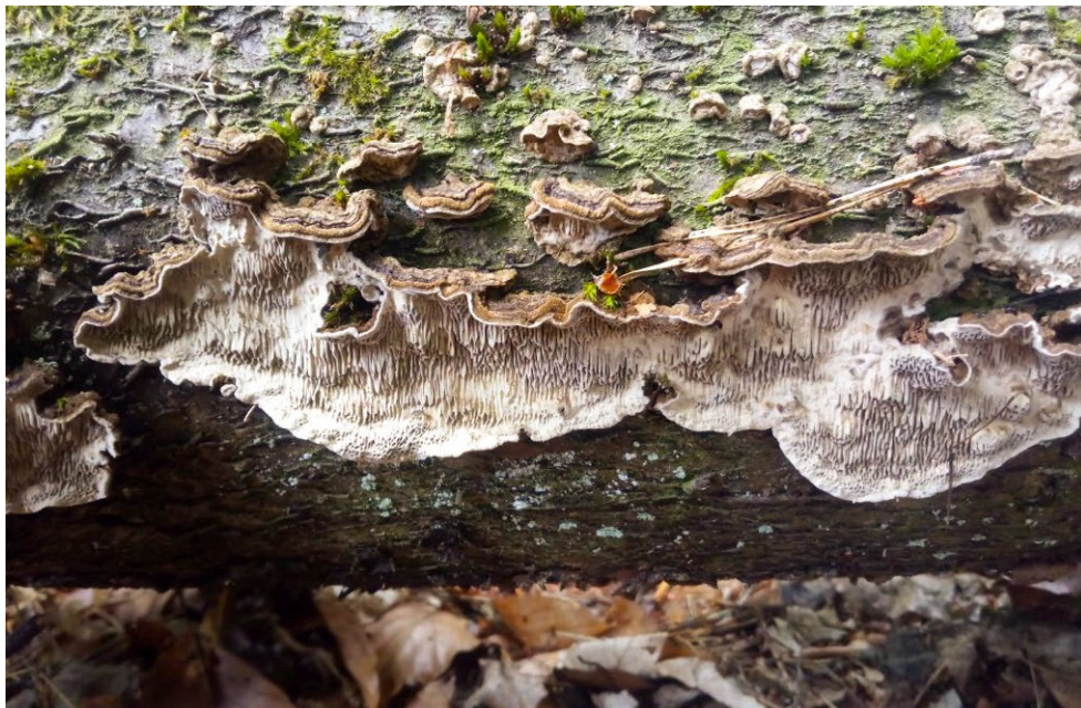
Fot. 28. Owocniki smoluszniaka wielkoporego Podofomes mollis WA0000165783 ( ; 08.11.2023).

Photo 28. Podofomes mollis WA0000165783 sporocarps ( ; 08.11.2023).