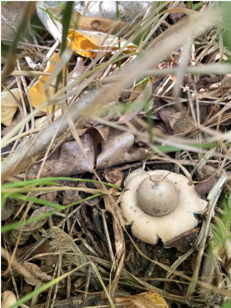
Fot. 16. Owocnik gwiazdosza frędzelkowatego Geastrum fimbriatum WA0000165584 ( 11.10.2023).

ED 06, Kotlina Warszawska, woj. mazowieckie, pow. warszawski, gm. Warszawa,