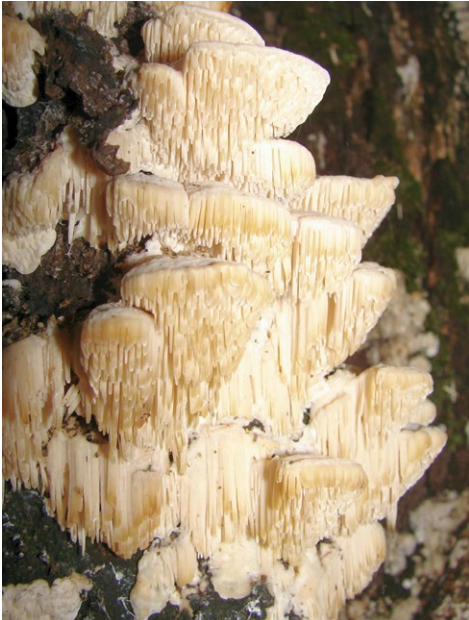
Fot. 19. Owocnik kolczatka strzępiastego Hericum cirrhatum WA0000165823 ( 07.10.2023).

BB 84, Pojezierze Wałeckie, woj. zachodniopomorskie, pow. drawski, gm. Wierzchow, Otrzep, N 53.4167, E 16.2140, las mieszany, pień obumarłego Bk, kilkanaście