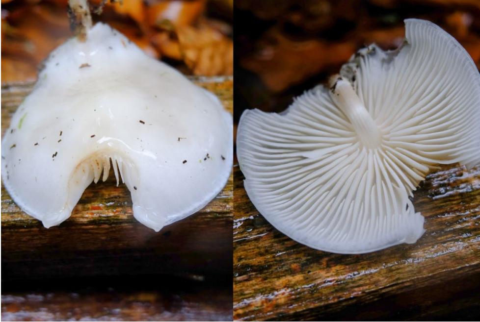
Fot. 25. Owocnik monetki bukowej Mucidula mucida. Photo 25. Mucidula mucida sporocarp.