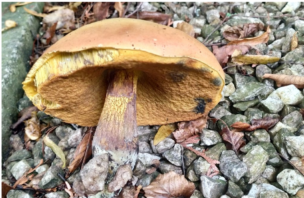
Fot. 9. Owocnik borowika ponurego Boletus luridus WA0000165858 ( ; 28.08.2023).

1. AB 93, Wzgórza Bukowe, woj. zachodniopomorskie, pow. gryfiński, gm. Stare Czarnowo, Binowo, N 53.3228, E 14.6239, kwaśna buczyna, drewno zagrzebane głąbo-