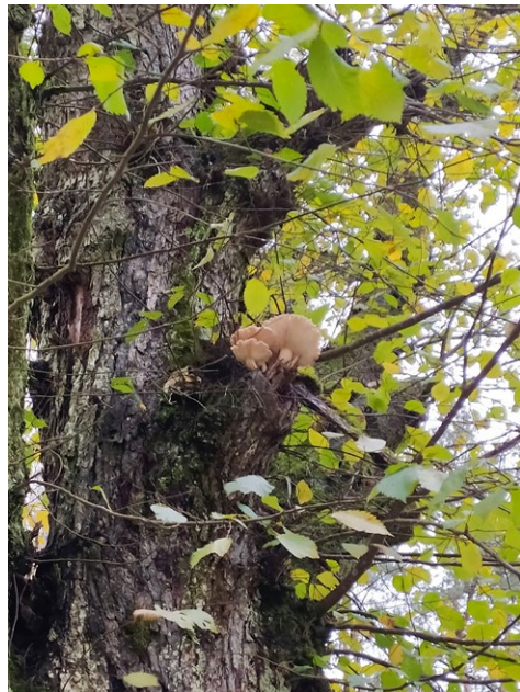
Fot. 22. Owocniki bokownika wiązowego Hypsizygus ulmarius ( ; 28.10.2023).