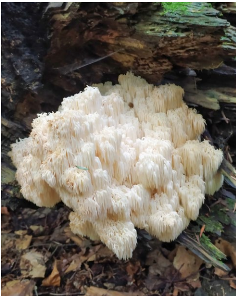
Fot. 21. Owocnik sopłówki jodłowej Hericium flagellum ( ; 16.10.2023). Photo 21. Hericium flagellum sporocarp ( ; 16.10.2023).