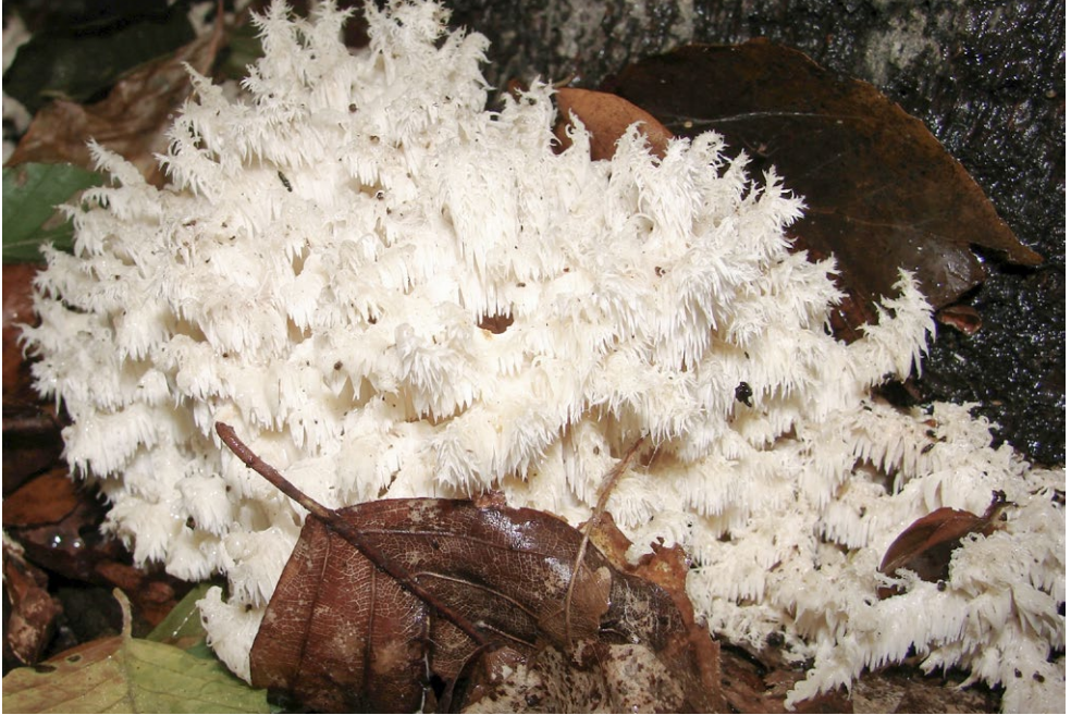
Fot. 20. Owocnik sopłówki bukowej Hericium coralloides. Photo 20. Hericium coralloides sporocarp.