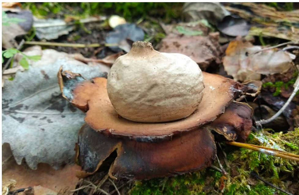
Fot. 18. Owocnik gwiazdosza potrójnego Geastrum triplex WA0000165874 ( 25.09.2023).