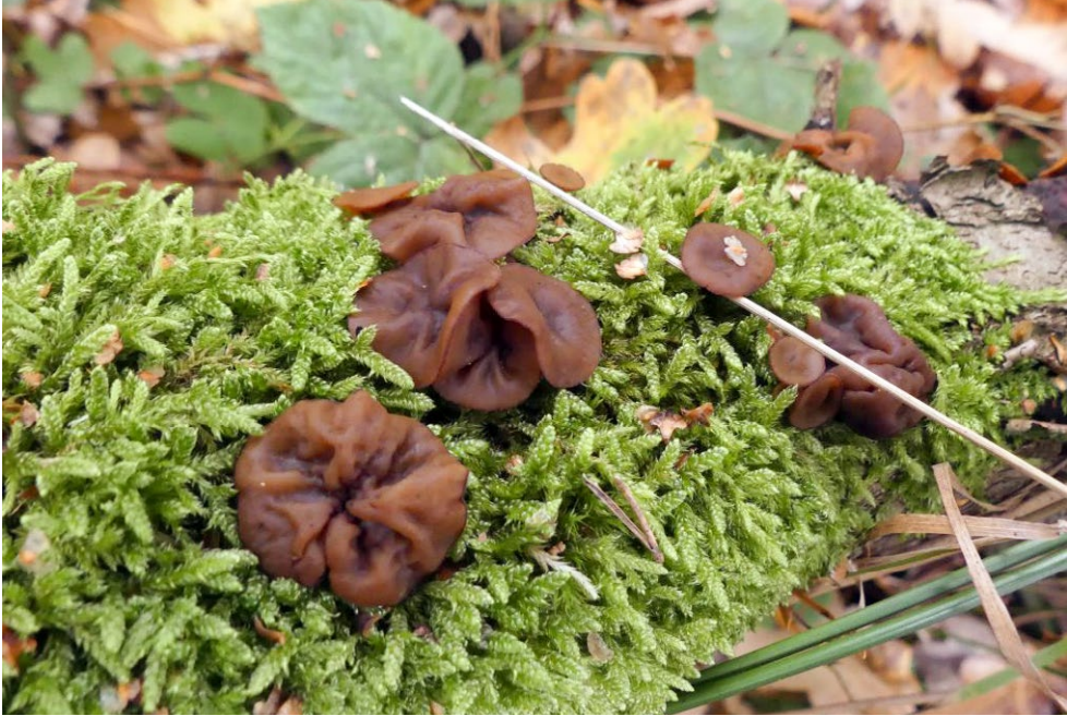
Fot. 4. Owocniki baziówki mocnej Rutstroemia firma WA0000165693 ( 07.11.2023). Photo 4. Rutstroemia firma WA0000165693 sporocarps ( 07.11.2023).