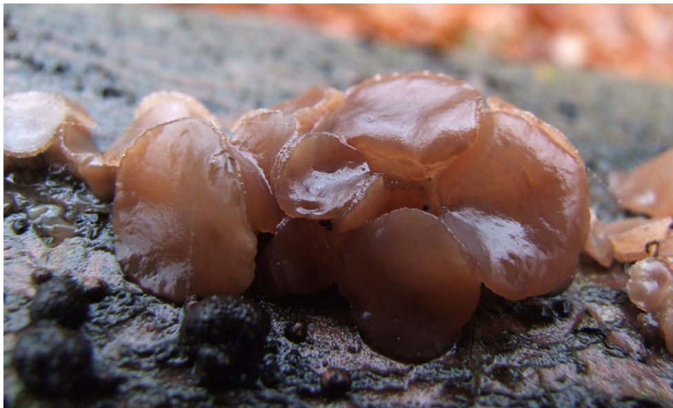
Fot. 3. Owocniki galaretówki przejrzystej Neobulgaria pura WA0000165594.

Photo 3. Neobulgaria pura WA0000165594 sporocarps.