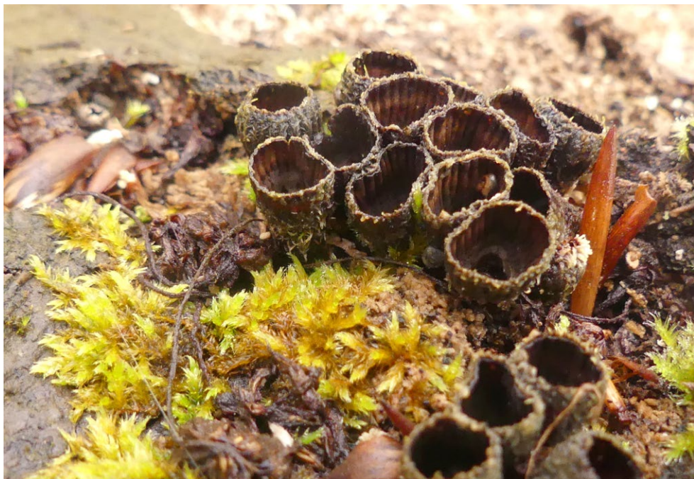
Photo 6. Crinipellis scabella WA0000162788 fruiting body ( ; 21.11.2019).

Fot. 7. Owocniki kubka prążkowanego Cyathus striatus WA0000162789 ( ; 14.04.2023).