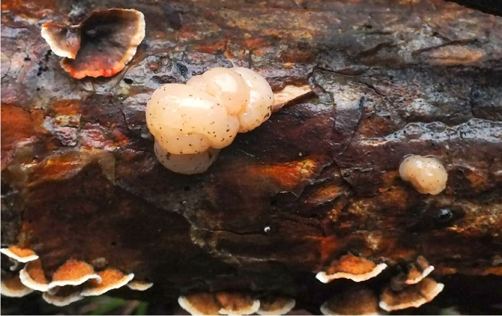
Fot. 16. Owocniki trzęsaka mózgowatego Naematelia encephala WA0000162855 oraz będącego jego gospodarzem skórnika krwawiącego Stereum sanguinolentum WA0000162893.