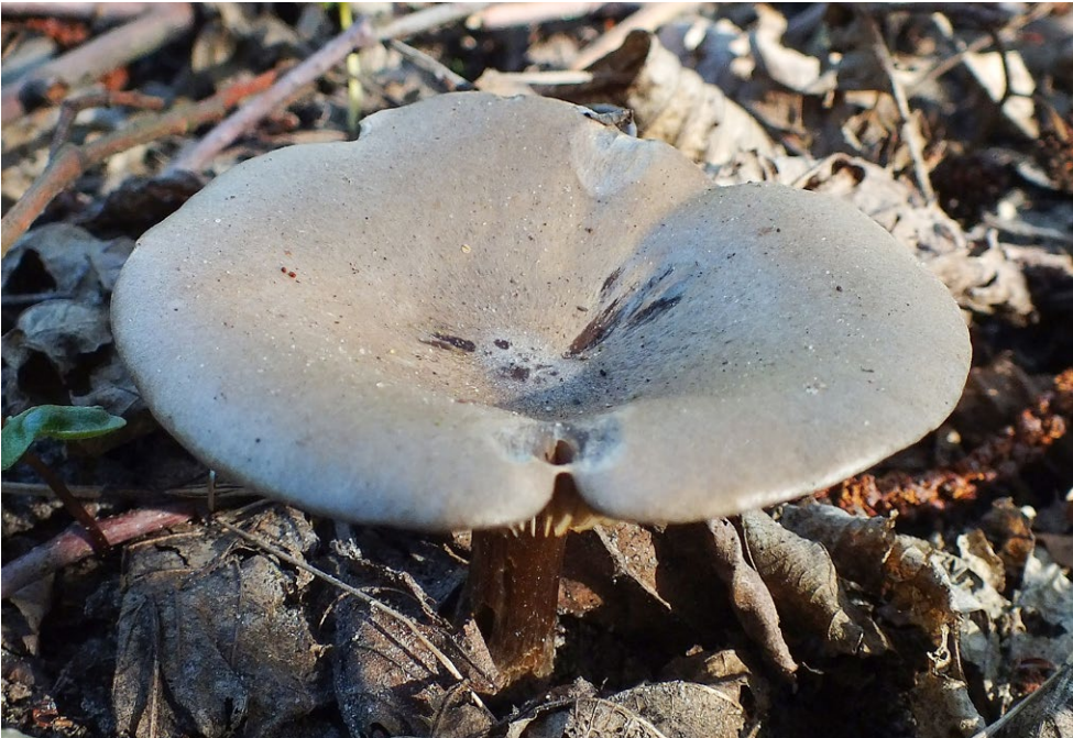
Fot. 14. Owocnik ciemnobiałki krótkotrzonowej Melanoleuca brevipes WA0000162849 ( ; 21.04.2016).

2. AB 84, Równina Goleniowska, woj. zachodniopomorskie, pow. Szczecin, gm. Szczecin, Szczecin-Załom, N 53.4275, E 14.7151, las mieszany (Db, Bk, Wz, Brz), kłoda Db, kilkaset owocników w kilku kępach, 22.02.2023, leg. & det. ML [WA0000162853].