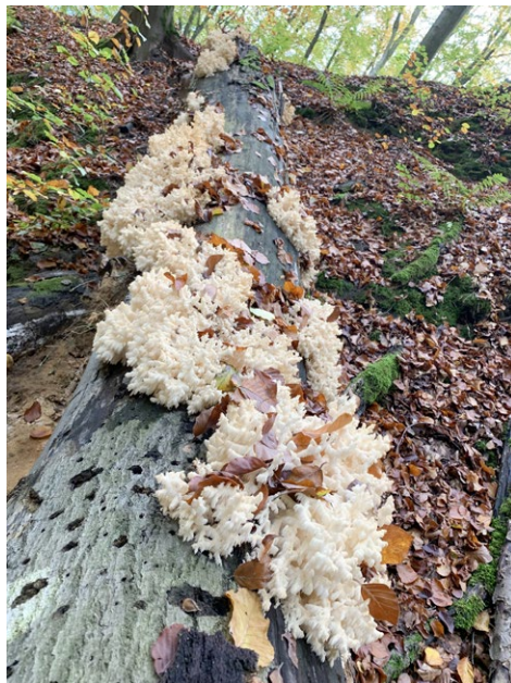
Fot. 10. Kłoda Fagus sylvatica z owocnikami soplówki bukowej Hericium coralloides zanotowany w Żubrowie.

Photo 10. Fagus sylvatica log with Hericium coralloides fruiting bodies noted in Żubrów.