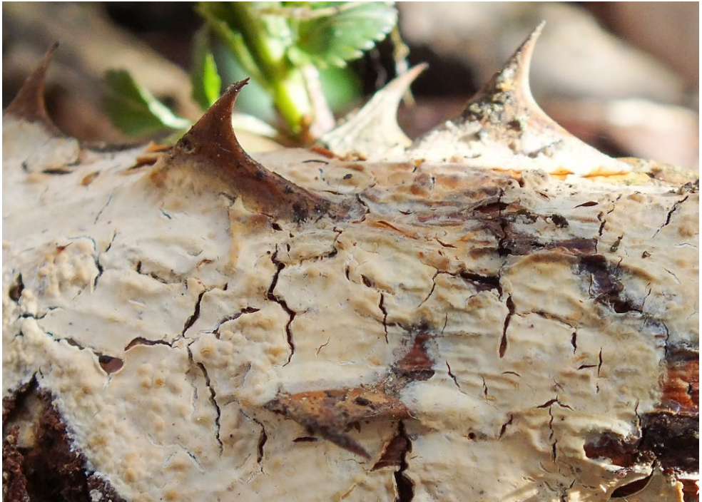
Fot. 22. Owocnik woskownika pozrastanego Radulomyces confluens WA0000162880. Photo 22. Radulomyces confluens WA0000162880 fruiting body.