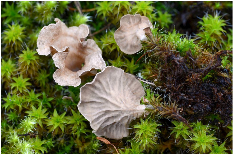
Fot. 3. Owocniki jęczyzka strefowanego Arrhenia spathulata. Photo 3. Arrhenia spathulata fruiting bodies.

BC 77, Kotlina Gorzowska, woj. wielkopolskie, pow. obornicki, gm. Oborniki, Nie-