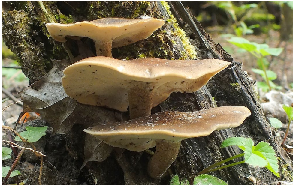
Fot. 19. Owocniki żagwi wiosennej Polyporus lepideus WA0000162874 ( ; 24.04.2023). Photo 19. Polyporus lepideus WA0000162874 fruiting bodies ( ; 24.04.2023).

28.05.2023, leg. & det. ML [WA0000162872]. Uwagi: stanowisko w pRP Przełomowa Dolina Gowienicy (N2000 Ostoja Goleniowska i N2000 Puszcza Goleniowska).