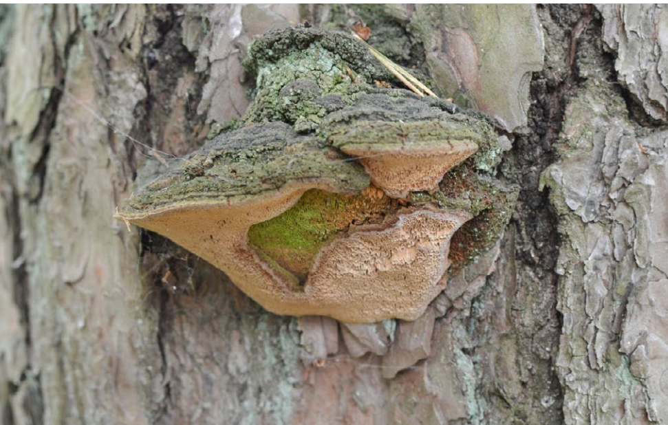
Fot. 20. Owocnik czyrogmatwicy sosnowej Porodaedalea pini WA0000162876. Photo 20. Porodaedalea pini WA0000162876 fruiting body.