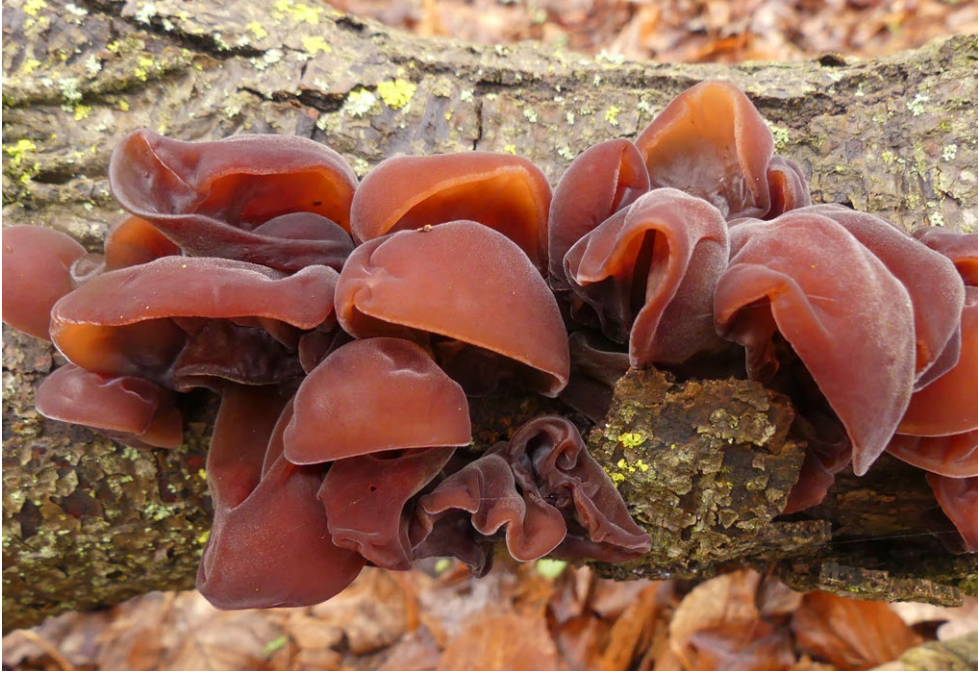
Fot. 4. Owocniki uszaka bżowego Auricularia auricula-judae WA0000162765 ( ; 14.04.2023). Photo 4. Auricularia auricula-judae WA0000162765 fruiting bodies ( ; 14.04.2023).