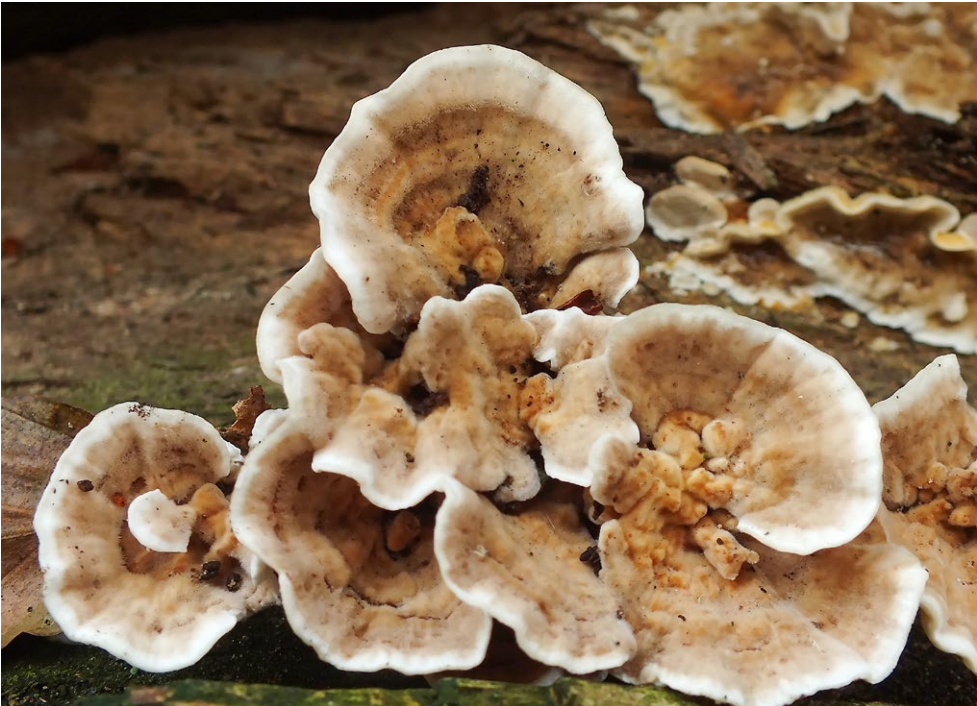
Fot. 24. Owocniki wrośniaka strefowanego Trametes ochracea WA0000162902 ( ; 24.11.2017).