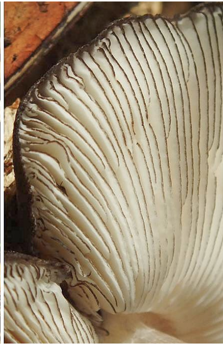
Fot. 18. Owocnik drobnoluszczyka czarnoostrowego Pluteus atromarginatus WA0000162871 ze zbliżeniem na ostrza blaszek ( ; 20.07.2016).