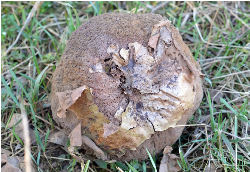
Fot. 13. Owocnik purchawicy olbrzymiej Langermannia gigantea zanotowany w Niemieczkowie ( ; 26.03.2023).

Photo 13. Langermannia gigantea fruiting body noted in Niemieczkowo (photo by BK; 26.03.2023).