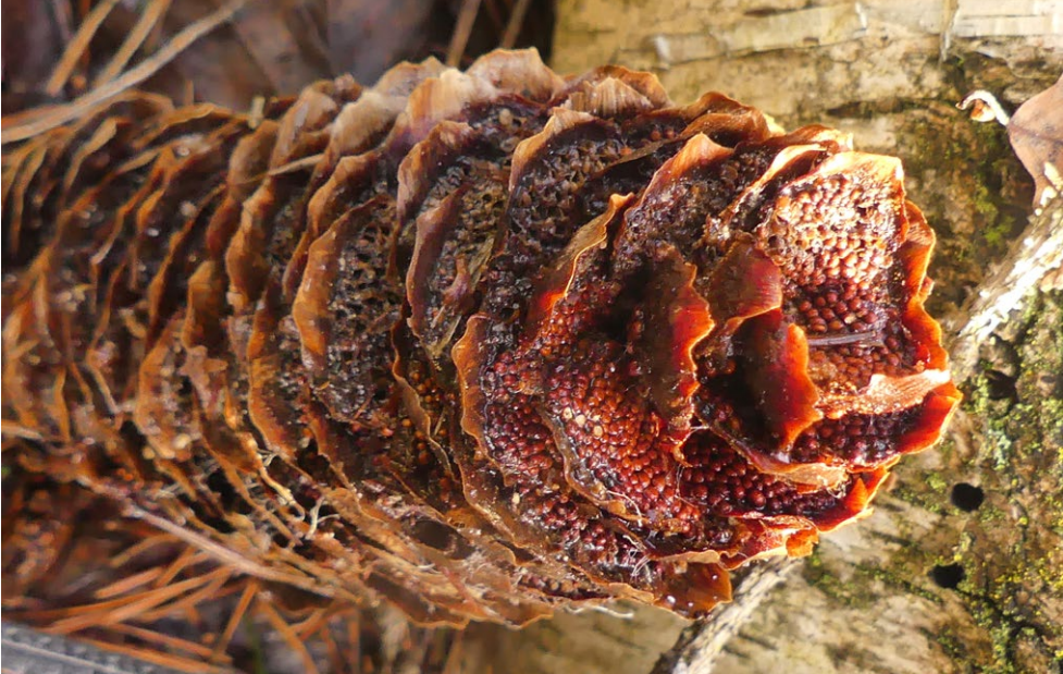
Fot. 23. Ecja Thekopsora areolata WA0000162897 ( ; 28.04.2023).