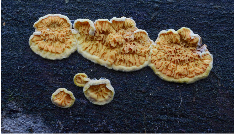
Fot. 21. Owocniki stroczniczka złotawego Pseudomerulius aureus WA0000162879. Photo 21. Pseudomerulius aureus WA0000162879 fruiting bodies.