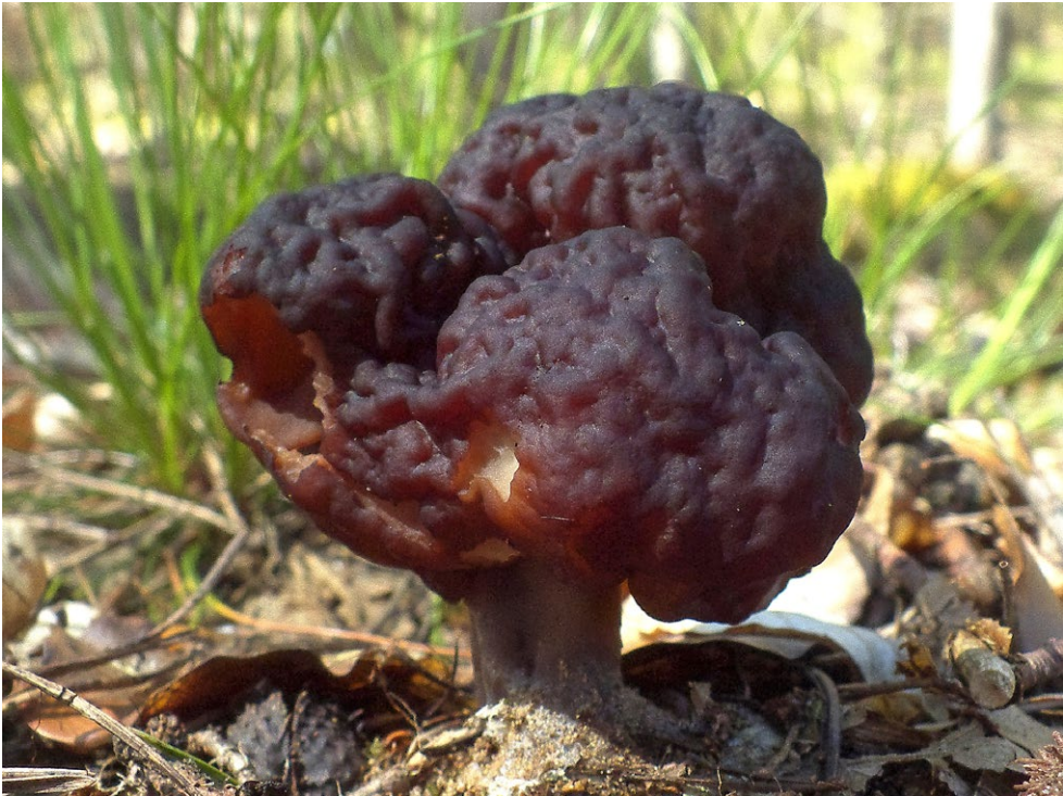
Fot. 1. Owocnik piestrzenicy kasztanowatej Gyromitra esculenta WA0000162749 ( ; 30.04.2023). Photo 1. Gyromitra esculenta WA0000162749 fruiting body ( ; 30.04.2023).