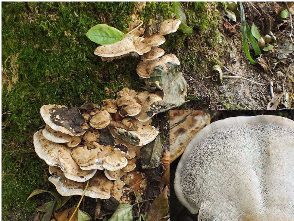
Fot. 5. Owocniki szaroporki odymionej Bjerkandera fumosa WA0000162773 ze zbliżeniem na hymenofor ( 08.10.2014).

Photo 5. Bjerkandera fumosa WA0000162773 fruiting bodies with a focus on hymenophore (photo by GD; 08.10.2014).