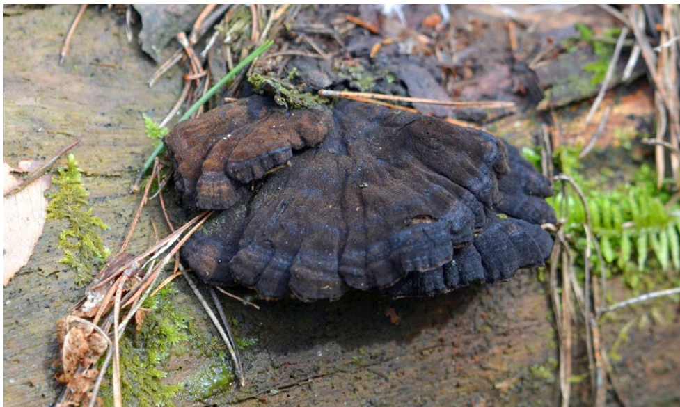
Fot. 12. Owocnik smoluchy świerkowej Ischnoderma benzoinum WA0000162833 ( 26.03.2023). Photo 12. Ischnoderma benzoinum WA0000162833 fruiting body ( 26.03.2023).