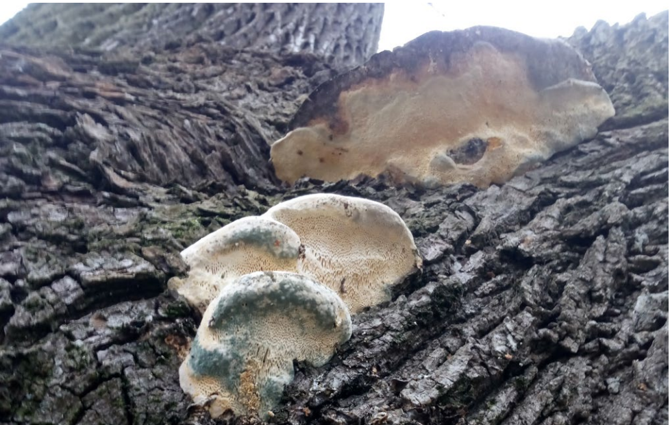
Fot. 17. Owocniki napnia topolowego Oxyporus populinus WA0000162856 ( ; 14.02.2023).