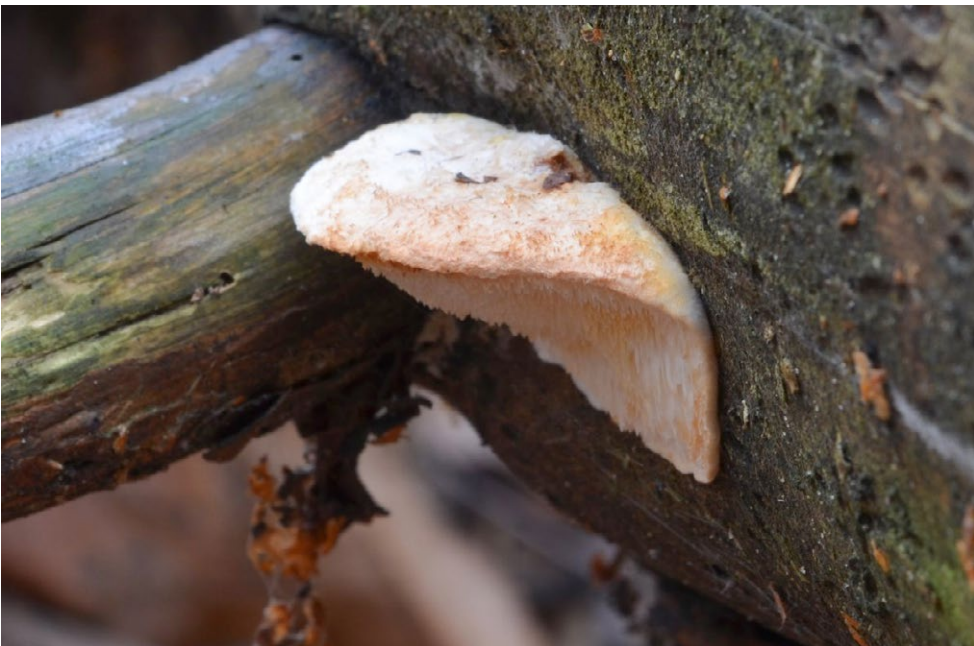
Fot. 9. Owocnik rdzawoporka kruchego Fuscopostia fragilis WA0000162812 ( ; 04.12.2022). Photo 9. Fuscopostia fragilis WA0000162812 fruiting body ( ; 04.12.2022).

CB 20, Pojezierze Bytowskie, woj. pomorskie, pow. bytowski, gm. Miastko, Zadry, N 54.0128, E 17.0715, buczyna pomorska, kłoda Bk, kilka owocników, 04.03.2023, leg. & det. ML [WA0000162816]. Uwagi: stanowisko w OCK Źródliskowy Obszar Brdy i Wieprzy na Wschód od Miastka, N2000 Miasteckie Jeziora Lobeliowe.