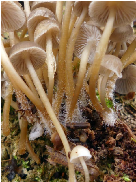
Fot. 15. Owocniki grzybówki dzwoneczkowatej Mycena tintinnabulum WA0000162852.