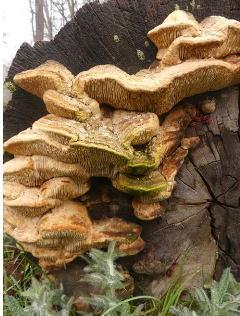
Fot. 8. Owocniki gmatwka dębowego Daedalea quercina WA0000162794 ( ; 14.04.2023).

AB 94, Wzgórza Bukowe, woj. zachodniopomorskie, pow. gryfiński, gm. Stare Czarnowo, Kołowo, N 53.3464, E 14.6533, łęg olszowy, konar Db, kilkanaście owocników, 29.04.2023, leg. & det. GD [WA0000162795]. Uwagi: stanowisko w SzPK „Puszcza Bukowa” i N2000 Wzgórza Bukowe.