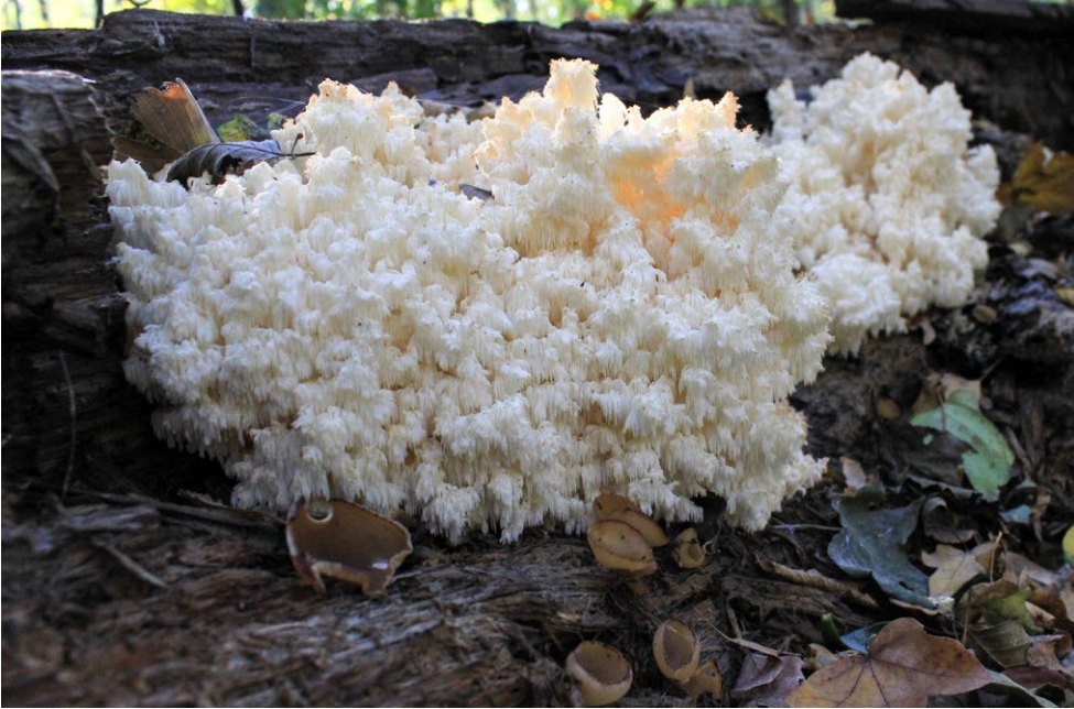
Fot. 11. Owocnik soplówki bukowej Hericium coralloides zanotowany w Poznaniu-Golećcinie.

Photo 11. Hericium coralloides fruiting body noted in Poznań-Golećcin (photo by MU; 13.09.2022).