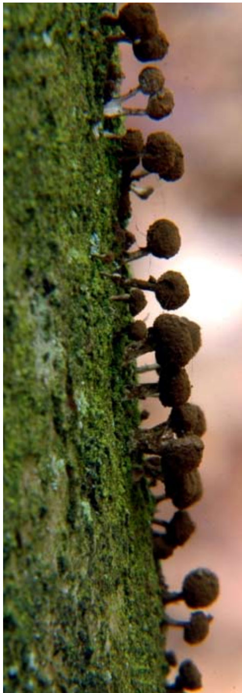
Ryc. 1. Owocniki suchogłówki korowej Phleogena faginea . Fig. 1. Fructification of Phleogena faginea .

Owocniki wyrastają na korowinie, w spękaniach kory lub na murszejącym drewnie pniaków, pni lub konarów martwych lub zamierających, rzadko żywych drzew (ryc. 1).