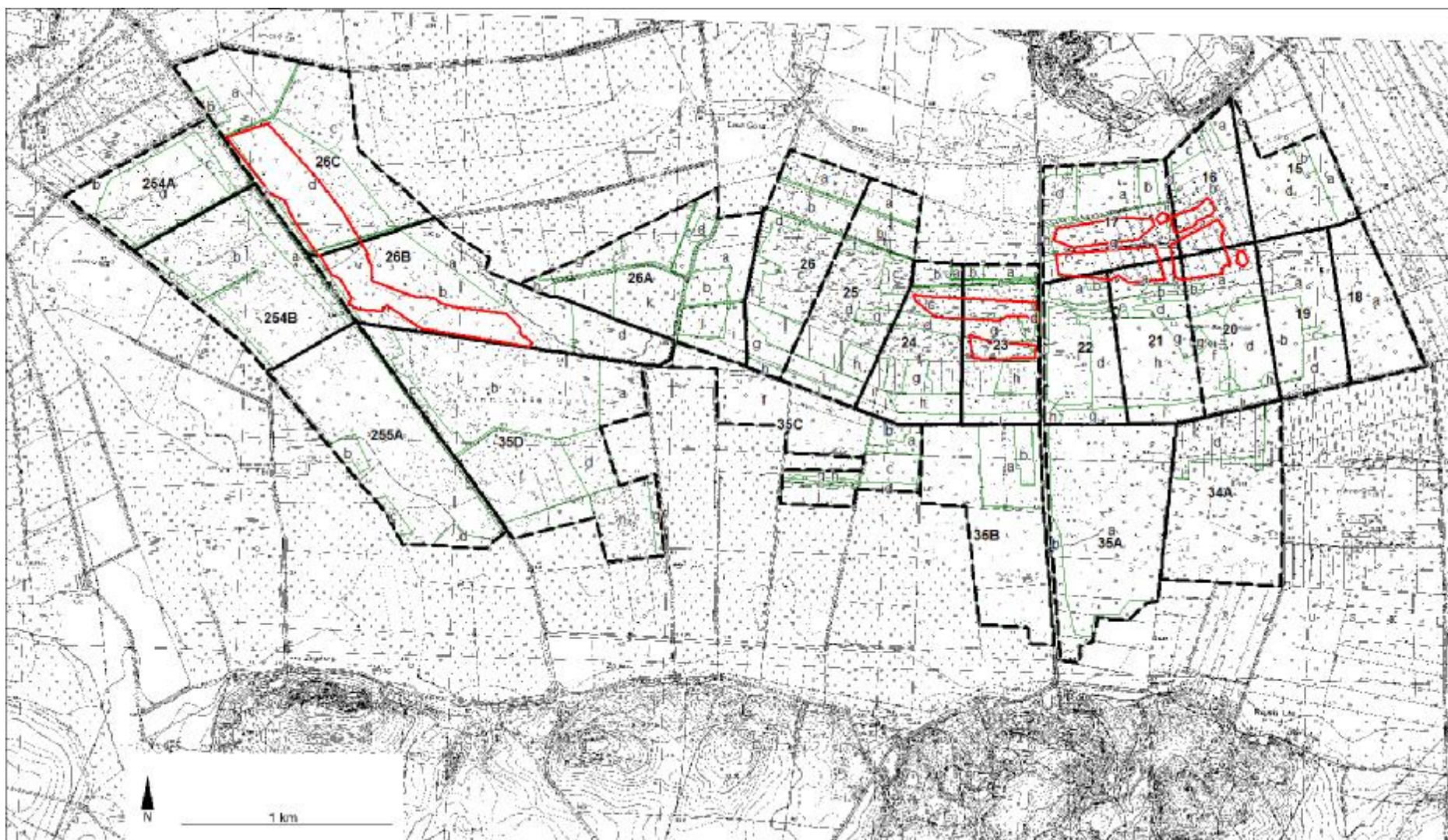
Lokalizacja zabiegu w rezerwacie Bagna Izbickie. Dotyczy zakresienia czerwoną linią.